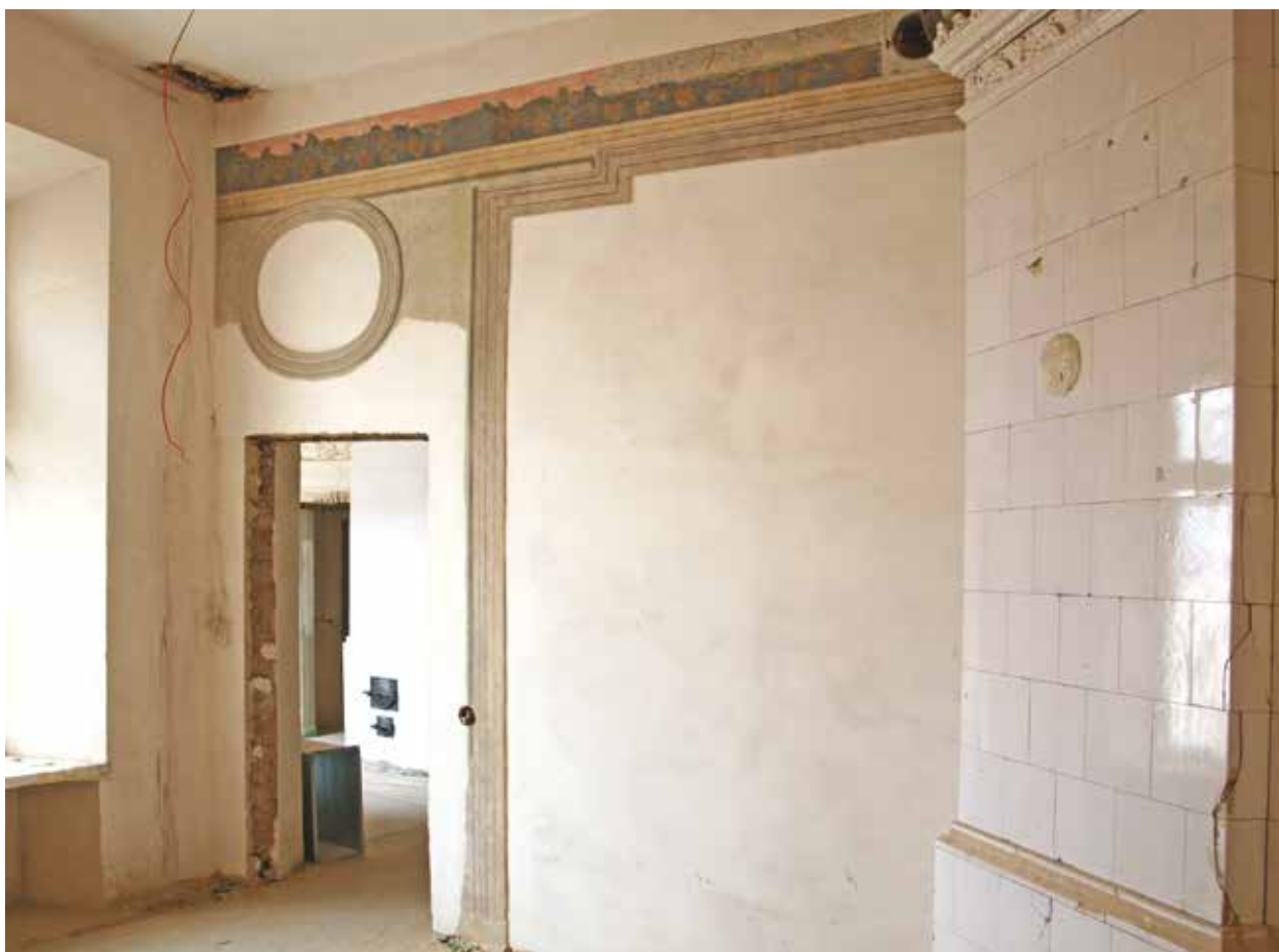
5. Antro aukšto 10 patalpa po sienų tapybos restauravimo, Indrės Valkiūnienės nuotrauka, 2014

Room 10 of the 1 st floor after restoration of mural painting