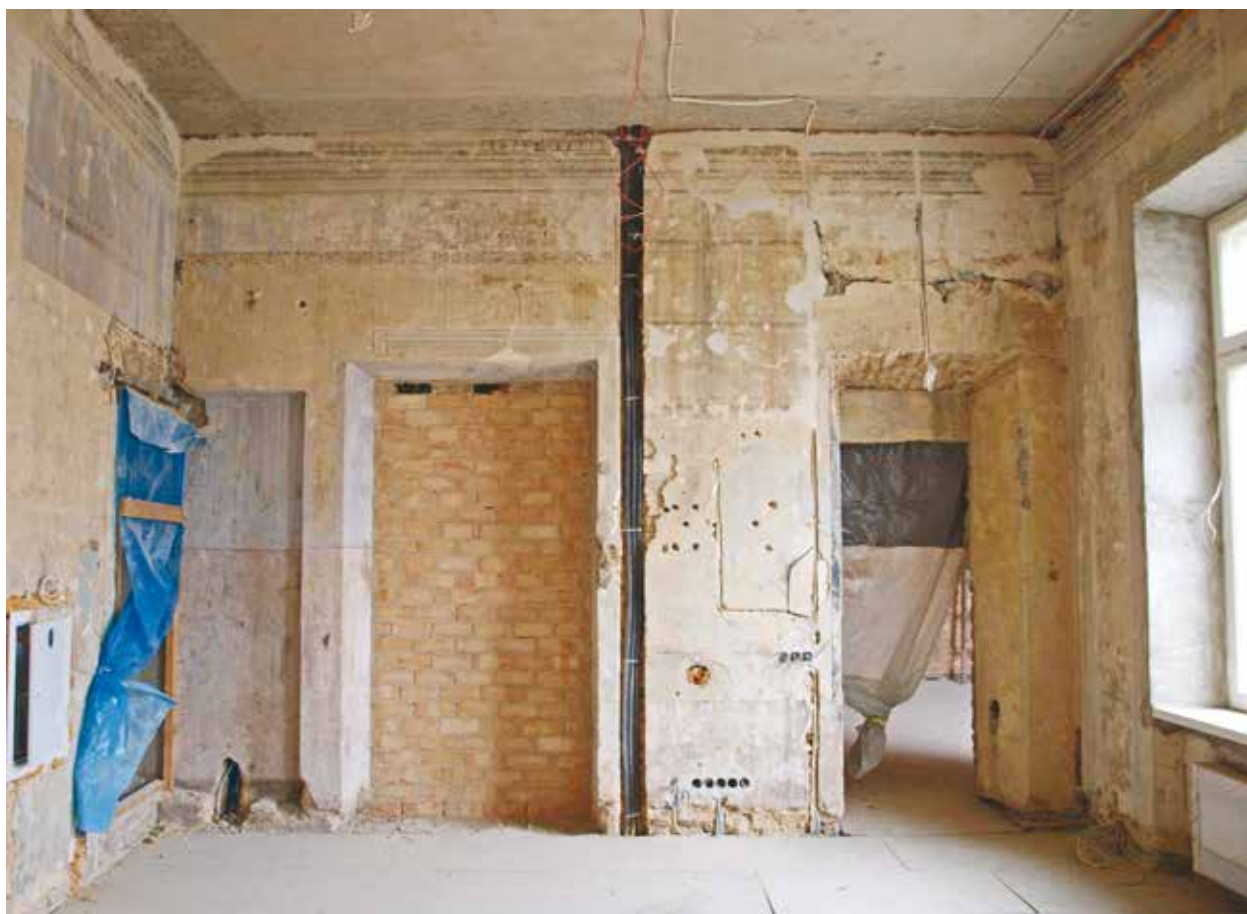
10. Tapyta audinio imitacija po atidengimo trečio aukšto 16 patalpoje, Indrės Valkiūnienės nuotrauka, 2015 Painted fabric imitation after uncovering, room 16, 2 nd floor

vakarinėje pusėje [9 il.], todėl atkuriant trūkstamas dalis buvo remtasi čia išlikusia tapyba. Tačiau mažiau išlikusioje rytinėje pusėje ir visiškai sunaikintoje pietinėje dalyje retušavimui sąmoningai buvo pasirinkti šviesesnių tonų mėlyni atspalviai.