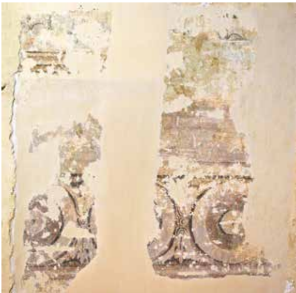
2. Išlikęs XIX a. pirmos pusės tapyto panelio fragmentas antro aukšto 14 patalpoje, Indrės Valkiūnienės nuotrauka, 2013

Surviving fragment of a painted panel from the first half of the 19 th century in room 14 of the 1 st floor