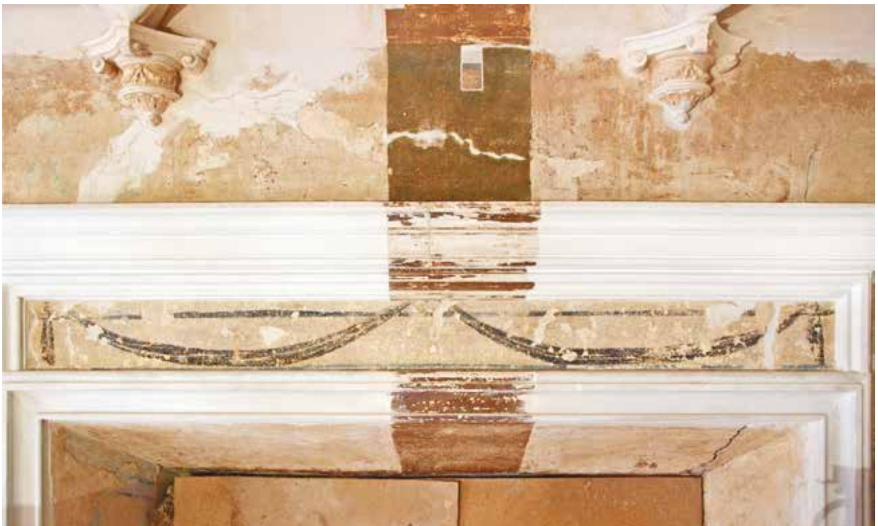
4. Išlikęs XIX a. sienų tapybos fragmentas virš durų antro aukšto 13 patalpoje, Indrės Valkiūnienės nuotrauka, 2013

Surviving fragment of mural painting from the late 18 th century in room 14 of the 1 st floor