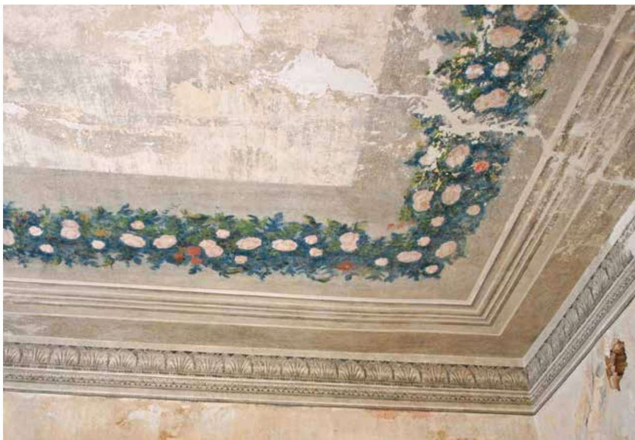
9. Vakarinė lubų dalis restauravimo metu trečio aukšto 14 patalpoje, Indrės Valkiūnienės nuotrauka, 2014

Western part of the ceiling during restoration, room 14, 2 nd floor