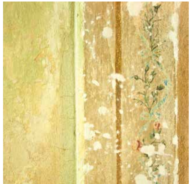
3. Išlikęs XVIII a. pabaigos sienų tapybos fragmentas antro aukšto 14 patalpoje, 2013

Surviving fragment of a painted panel from the first half of the 19 th century in room 14 of the 1 st floor