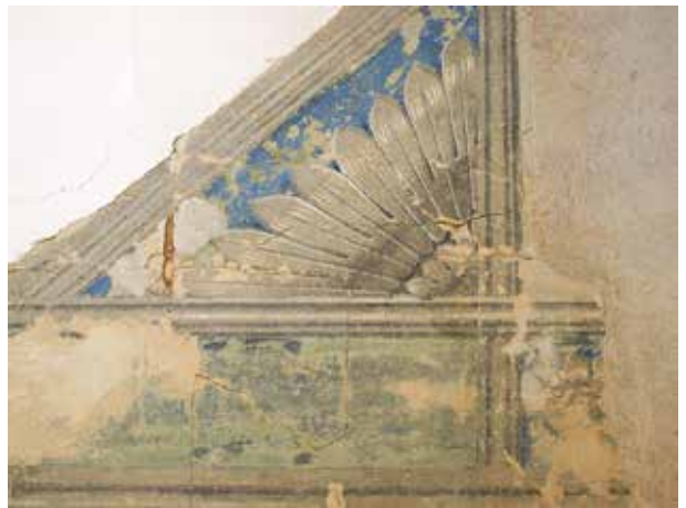
11. XIX a. lubų tapyba po atidengimo trečio aukšto 9 patalpoje, 2015

19 th century ceiling painting after uncovering, room 9, 2 nd floor