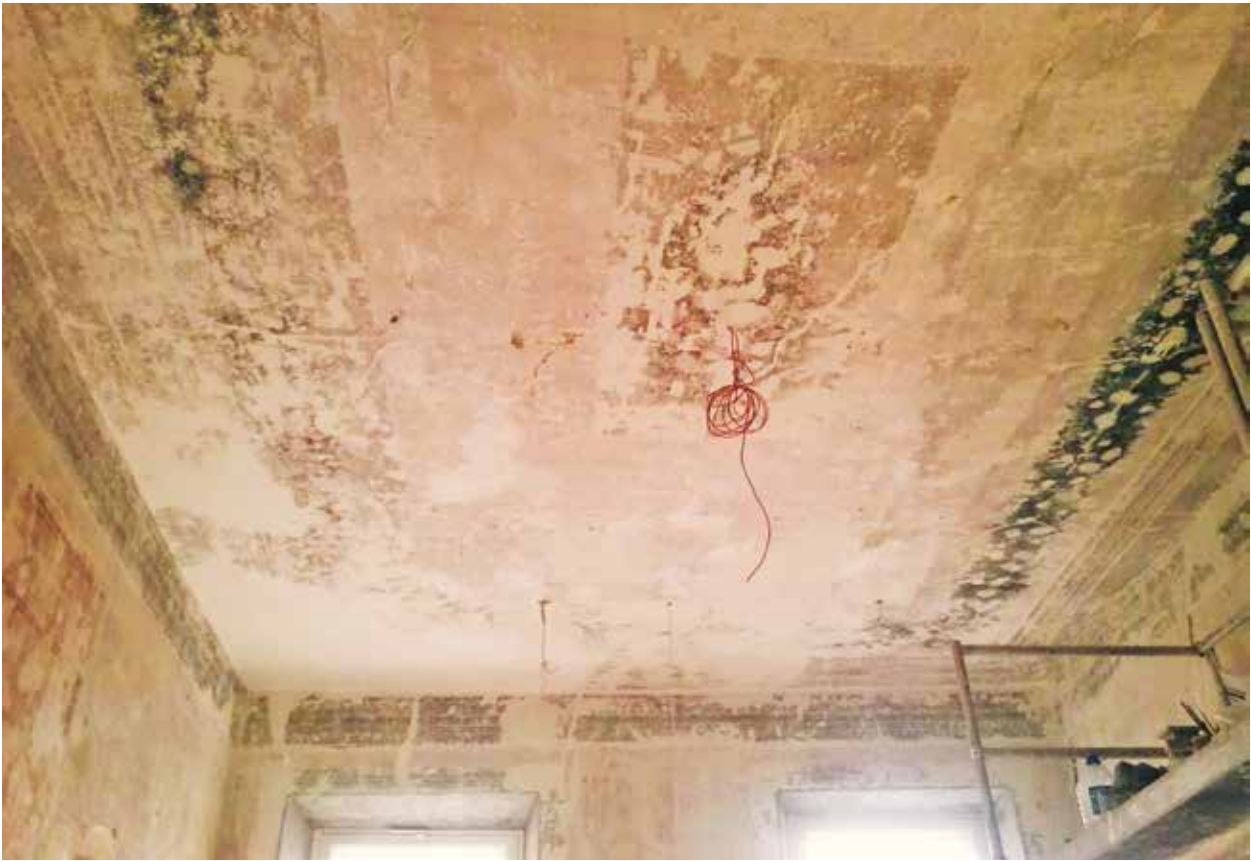
8. Lubų tapyba po atidengimo trečio aukšto 14 patalpoje, 2014

Mural painting after uncovering, room 14, 2 nd floor