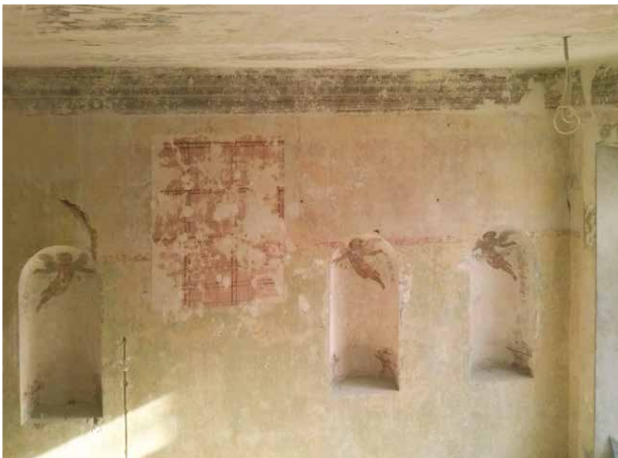
7. Rytinė siena po atidengimo trečio aukšto 14 patalpoje,