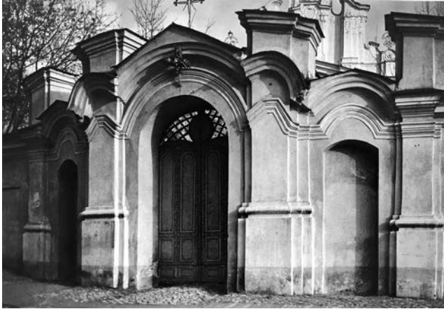
11. Šv. Jurgio Kankinio bažnyčios ir tvoros (neišliko) fragmentas, Jan Bułhak, 1912–1915, in: Jan Bułhak, Fotografijos. Vilnius. II dalis , Vilnius: Lietuvos nacionalinis muziejus, 2013

Detail of the Church of St George the Martyr and a fence (did not survive), Jan Bułhak, 1912–1915