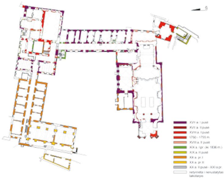
5. Komplekso pirmo aukšto raidos kartograma, parengė Evaldas Purlys, Ieva Blinstrubienė, 2017

Chart of the development of the basement rooms