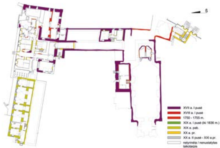
4. Komplekso rūšio patalpų raidos kartograma, parengė Evaldas Purlys, Ieva Blinstrubienė, 2017

Chart of the development of the basement rooms