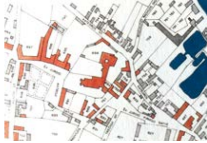
2. 1808 m. Vilniaus plano kopijos fragmentas, in: Vladas Drėma, Dingęs Vilnius , Vilnius: Versus Aureus, 2013, p. 47

Detail of a copy of a plan of Vilnius of 1808