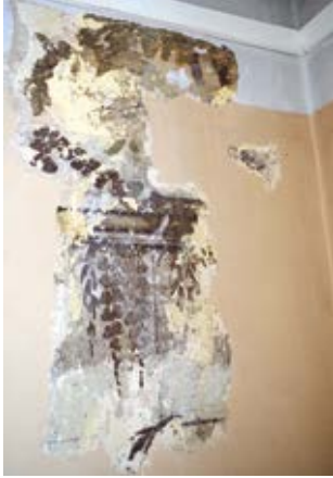
14. Varpinės antro aukšto patalpos polichrominis dekoras, 2017

Polychrome décor of the first-floor room of the bell tower