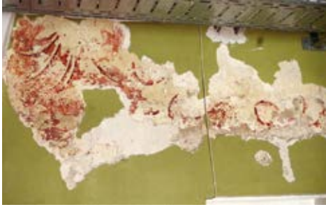
15. Vienuolyno didžiojo koridoriaus polichrominis dekoras, Vytauto Railos nuotrauka, 2017

Polychrome décor of the great corridor of the monastery