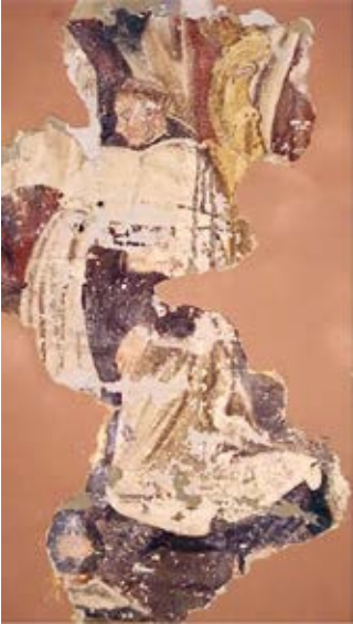
18. Bibliotekos figūrinės sienų tapybos fragmentas, 2017

Detail of figurative murals in the library