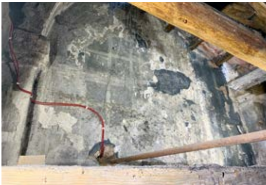
8. Vienuolyno I korpuso pietinio frontono fragmentas su XVII a. polichrominiu dekoru, 2019

Virš I korpuso pietinio fasado išliko frontonas, dabar atsідūręs pastogėje. Didelėje nišoje jo centre išlikęs polichrominis dekoras, imituojantis smulkiais rėmeliais suskaidytą langą [8 il.]. Frontono nišos tinkas