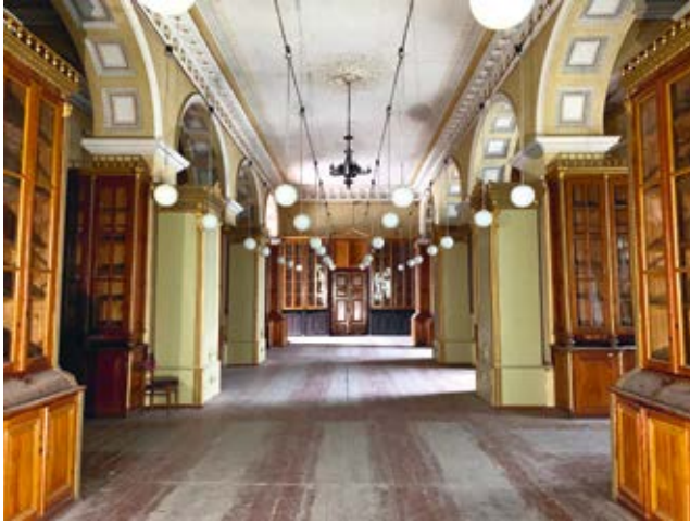
19. Seminarijos antro aukšto bibliotekos interjeras (XX a. pr.), 2019

Library interior on the first floor of the seminary