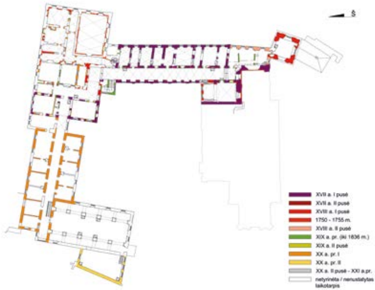
6. Komplexo antro aukšto raidos kartograma, parengė Evaldas Purlys, Ieva Blinstrubienė, 2017

Chart of the development of the first-floor rooms