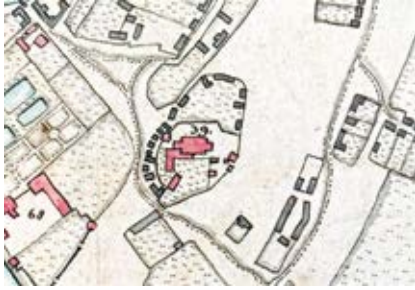
1. 1737 m. Vilniaus plano fragmentas, in: I. Tamošiūnienė, B. R. Vitkauskienė, A. Žilevičiūtė, Vilniaus miesto planai , Vilnius: Lietuvos nacionalinis muziejus, 2016, p. 39