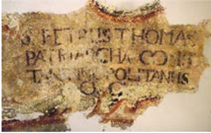
17. Refektoriumo skliauto plokštumoje atidengti įrašų fragmentai, Vytauto Railos nuotrauka, 2017

Details of exposed inscriptions on the refectory vault