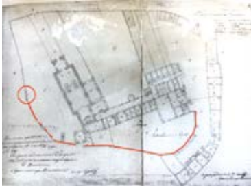
9. 1836 m. žemutinio aukšto planas. Esama padėtis su pažymėtais iki šių dienų išlikusiais mūrinės tvoros fragmentais ir arkadine varpine, in: VRVA, f. 1019, ap. 11, b. 582

Plan of the lower floor of 1836. The existing situation with marked surviving fragments of a brick fence and an arcade bell tower