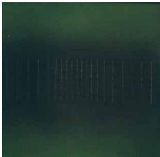
7. Kazimiera Zimblytė, Žalias , 1984, drobė, aliejus, 170×170, LATGA, Vilnius 2013