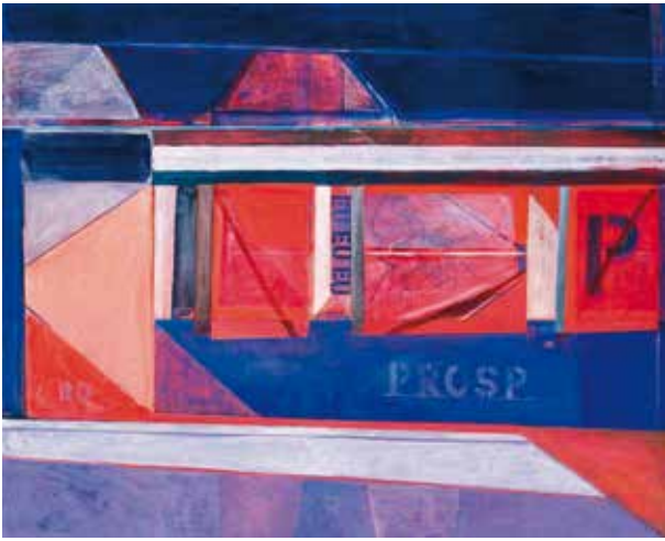
6. Elena Urbaitytė-Urbaitis, Niujorkas , 1984, drobė, aliejus, 107,5×123, LDM, T-10325

Elena Urbaitytė-Urbaitis, New York , 1984