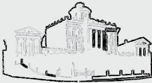
Lietuvos nacionaliniame dailės muziejuje demonstruojami XIV amžiuje falsifikuoti Lietuvos valdovų rūmus vaizduojantys piešiniai

The falsified XIV century drawings of the Grand Duke's Palace are exhibited at the National Art Museum of Lithuania