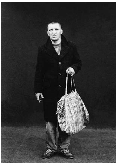
63, 64 Eglė Rakauskaitė, iš serijos Vilniaus benamiai , 2000

suformuluotas sąvokas, galima sakyti, kad iš E. Rakauskaitės darbų eliminuojamos fotografuojamiems žmonėms realiame gyvenime tenkančio socialinio vaidmens „dekoracijos“ ir visiškai nefiksuojamas to vaidmens „raiškos būdas“.