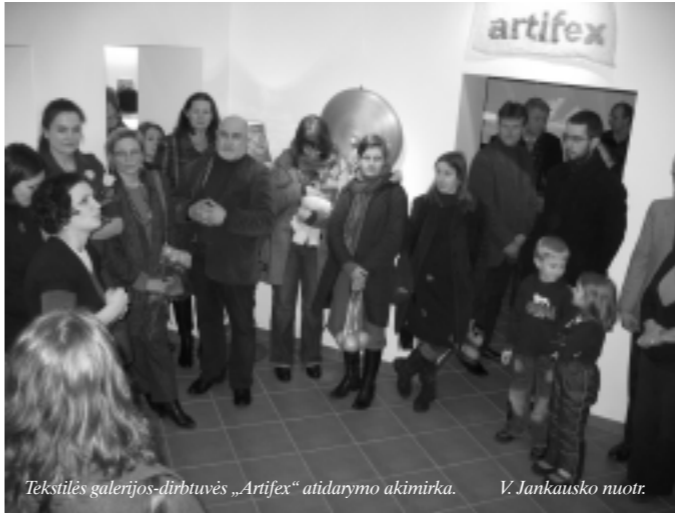
Tekstilės galerijos dirbtuvės „Artifex“ atidarymo akimirka.

INFORMACINIS BIULETENIS Nr. 2 (171) 2009 VASARIS/KOVAS