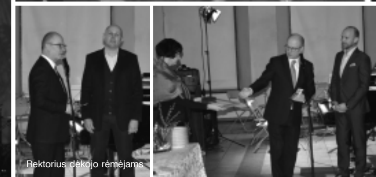
Rektorius dėkojo rėmėjams