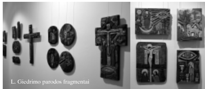
L. Giedrimo parodos fragmentai