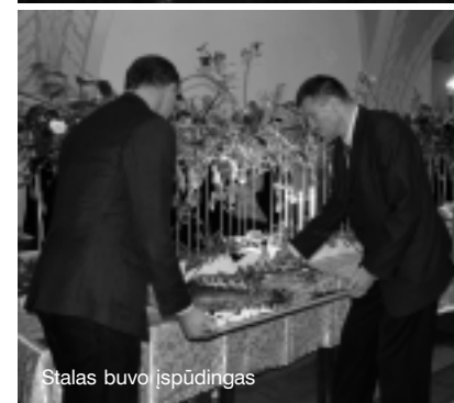
Stalas buvo įspūdingas