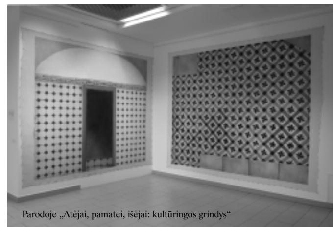
Parodoje „Atėjai, pamatei, išėjai: kultūringos grindys“