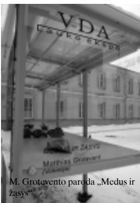
M. Grotovo paroda „Medus ir žasys“