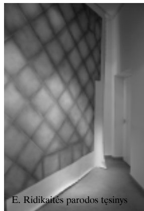
E. Ridikaitės parodos tęsinys