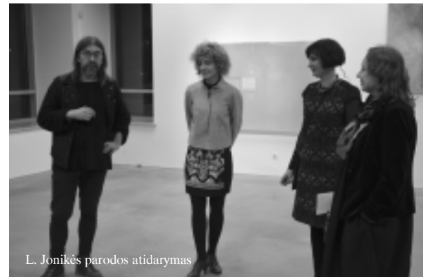
L. Jonikės parodos atidarymas