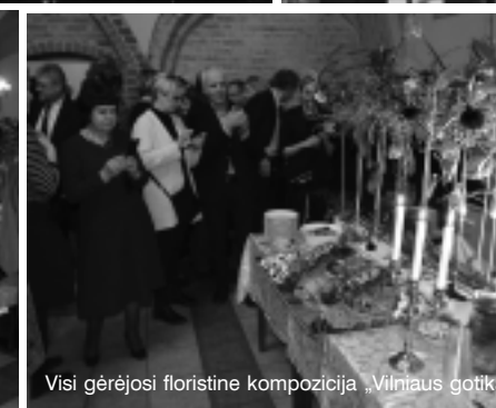
Visi gėrėjosi floristine kompozicija „Vilniaus gotika“