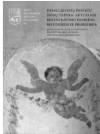
Pasaulietinių pastatų sienų tapyba: aktualios restauravimo teorijos, metodikos ir problemos. V., 2016 Sudarytoja Dalia Klajumienė Dailininkė Edita Namajūnienė

tavimas mene. Kokia vieta, kokiame laike buvo ir yra skiriama kūrėjo bei suvokėjo kūnui? Kiek, kur ir kada kūnas viešas ar privatus, kaip fiziškas kūnas tampa virtualiu?