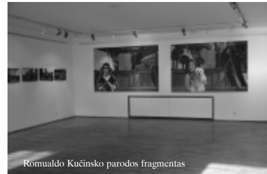
Romualdo Kučinsko parodos fragmentas