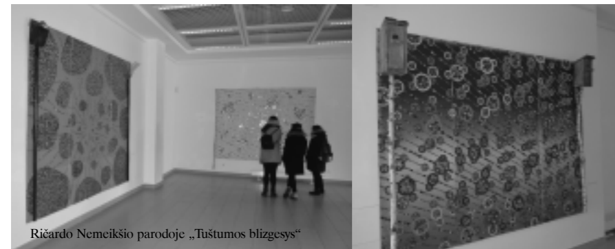
Ričardo Nemeikšio parodoje „Tuštumos blizgesys“