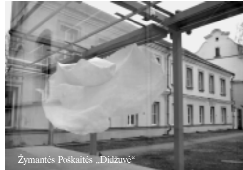
Žymantės Poškaitės „Didžuvė“

nytės-Paliukės personalinė paroda „Poko 8-osios“