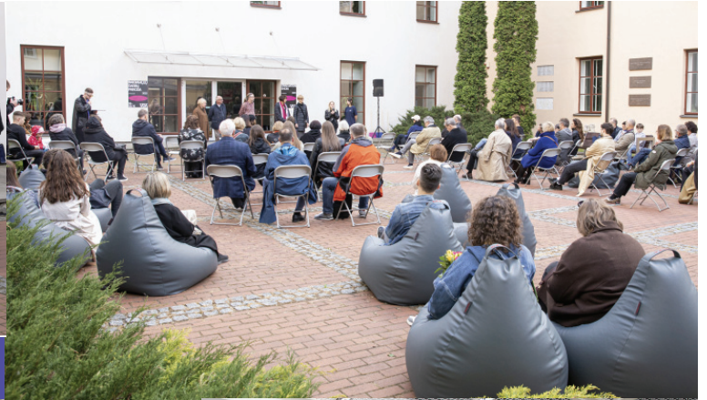
BAIGIAMŲJŲ DARBŲ PARODA