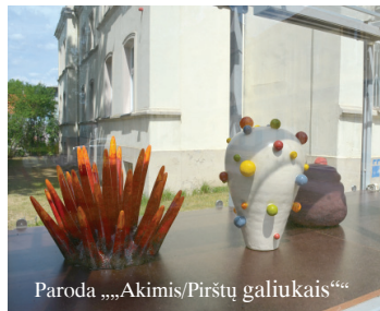
Paroda „Akimis/Pirštų galiukais“