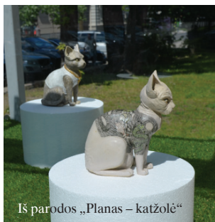
Iš parodos „Planas – katžolė“