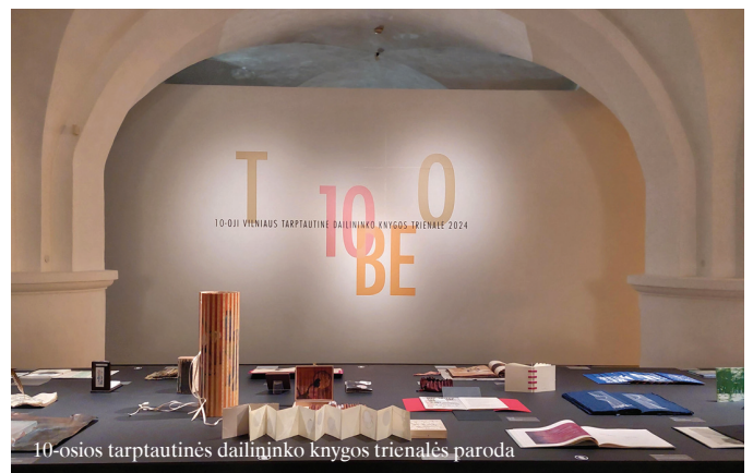
10-osios tarptautinės dailininko knygos trienalės paroda