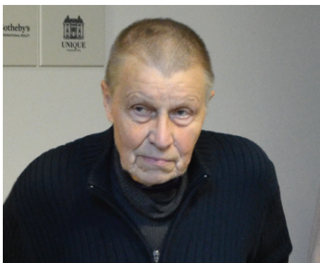
Grafikas, tapytojas, profesorius Mikalojus Povilas Vilitis