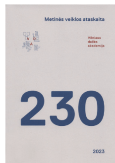
Vilniaus dailės akademija. Metinės veiklos ataskaita 2023. V., 2024 Sudarytoja Laima Spelskienė

Didelės apimties, gausiai iliustruota knyga, pasirodžiusi kaip neseniai VDA Meno doktorantūroje apginto projekto sudėtinė dalis – disertacija.