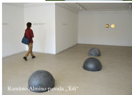
Ramūno Almino paroda „Toli“