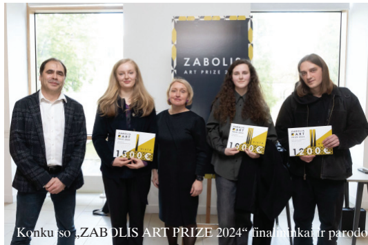
Konkurso „ZABOLIS ART PRIZE 2024“ finalininkai ir parodos fragmentas