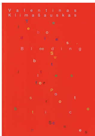
Valentinas Klimašauskas Telebodies. Bleeding Subtitles for Postrobotic Scenes. V., 2024 Dailininkas Nerijus Rimkus

Vilniaus dailės akademijos, VšĮ Baltish Arts Magazine ir Mousse Publishing išleista „Telekūniai. Kraujuojantys subtitrai postrobotinėms scenoms“ (anglų kalba, Telebodies. Bleeding Subtitles for Postrobotic Scenes , Milan: Mousse Publishing, 2024) analizuoja nestabilius ryšius tarp meninės artikuliacijos, meno sistemų ir kultūros darbuotojų vaidmenų Artimosios dabarties automatizacijos, dezinformacijos ir postrobotinės estetikos kontekste. Keistas „Teletabių“ ir „Videodromo“ hibridas algoritmų amžiuje, „Telekūniai“ siekia daugialypių techno-somatinų tikslų. Knygoje kalbama apie vis didėjantį mūsų