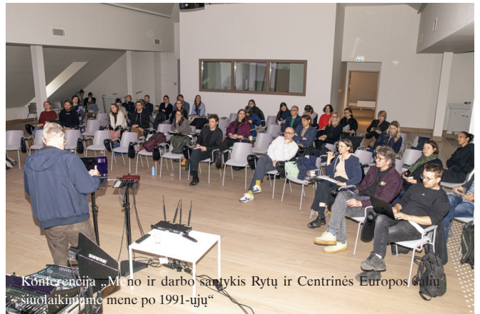
Konferencija „Meno ir darbo santykis Rytų ir Centrinės Europos šalių šiuolaikiniame mene po 1991-ųjų“