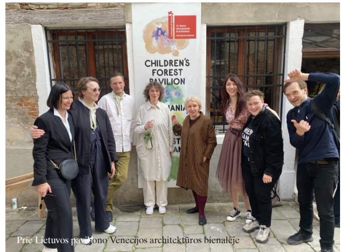
Prie Lietuvos paviljono Venecijos architektūros bienalėje