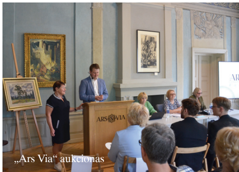
„Ars Via“ aukcionas

18 d. Venecijos architektūros bienalėje atidaromas Lietuvos paviljonas „Vaikų miško paviljonas“, kurį įgyvendina VDA Nidos meno kolonija