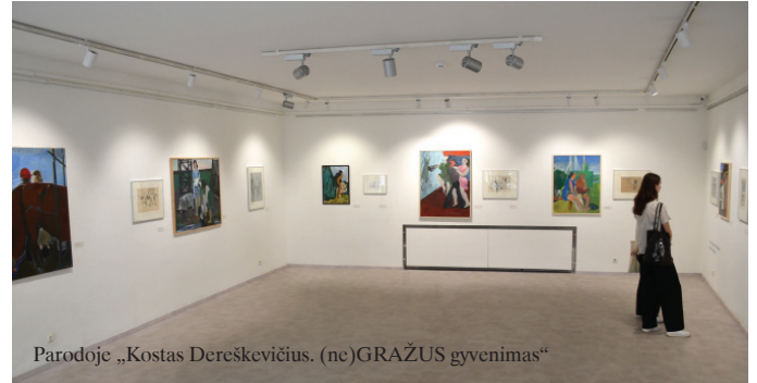
Parodoje „Kostas Dereškevičius. (ne)GRAŽUS gyvenimas“