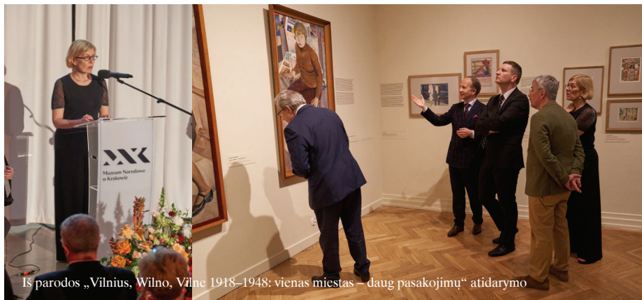
Iš parodos „Vilnius, Wilno, Vilne 1918–1948: vienas miestas – daug pasakojimų“ atidarymo