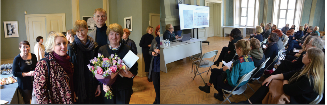
Iš Dailėtyros instituto mokslinės konferencijos „Amžius samprata ir raiška kultūroje“.

INFORMACINIS BIULETENIS Nr.5 (341) 2023 GEGUŽĖ