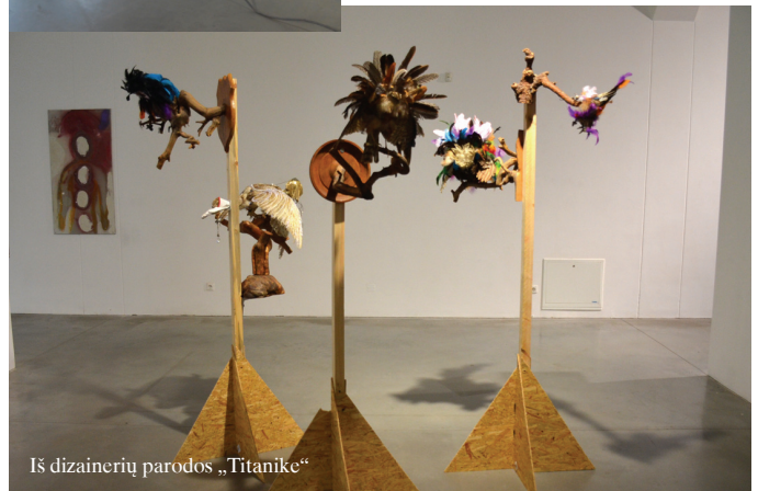
Iš dizainerių parodos „Titanike“