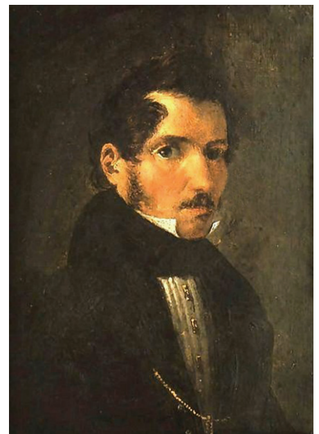
Tapytojas Aleksandras Slendzinskis (1803 03 13–1878 08 18). Autoportretas, 1849.