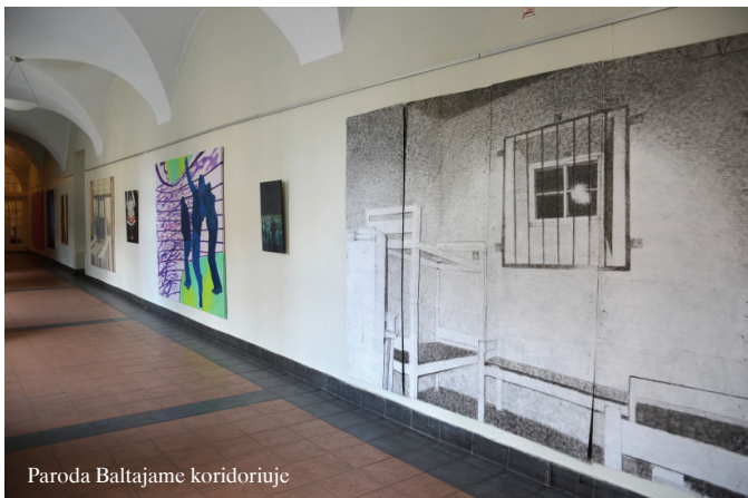
Paroda Baltajame koridoriuje