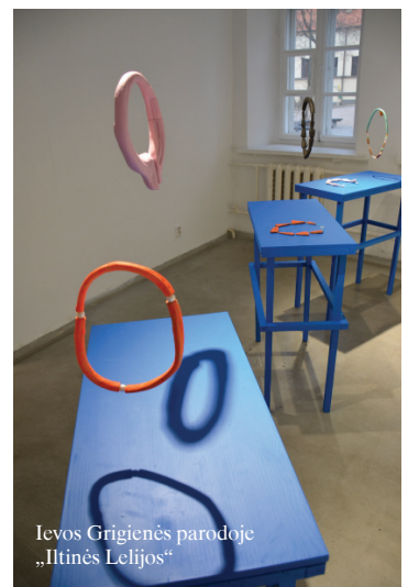
Ievos Grigienės parodoje „Iltinės Lelijos“