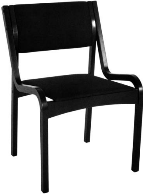
7. Jolanta Bagdzevičienė, Darbo kėdė (proj. Nr. 849-02), 1989

Jolanta Bagdzevičienė, Work chair (project No. 849-02), 1989