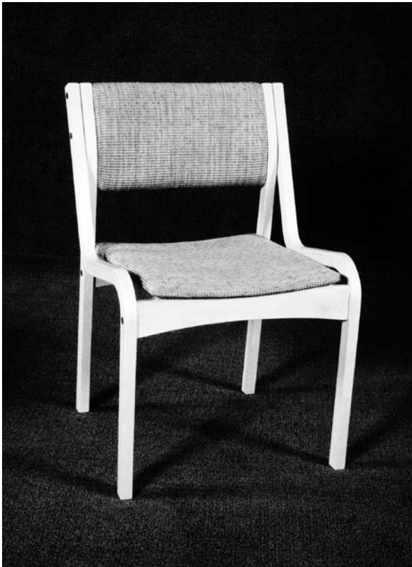
8. Jolanta Bagdzevičienė, Darbo kėdė (proj. Nr. 849-03), 1989

Jolanta Bagdzevičienė, Work chair (project No. 849-02), 1989