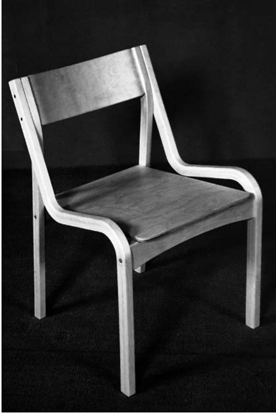
9. Jolanta Bagdzevičienė, Darbo kėdė (proj. Nr. 849-04), 1989

Jolanta Bagdzevičienė, Work chair (project No. 849-04), 1989