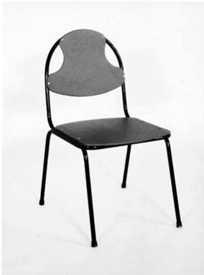
5. Jolanta Bagdzevičienė, Eksperimentinių kėdžių valgykloms serija (proj. Nr. 01/5270-04, 01/5270- 05, 01/5270-06), 1987