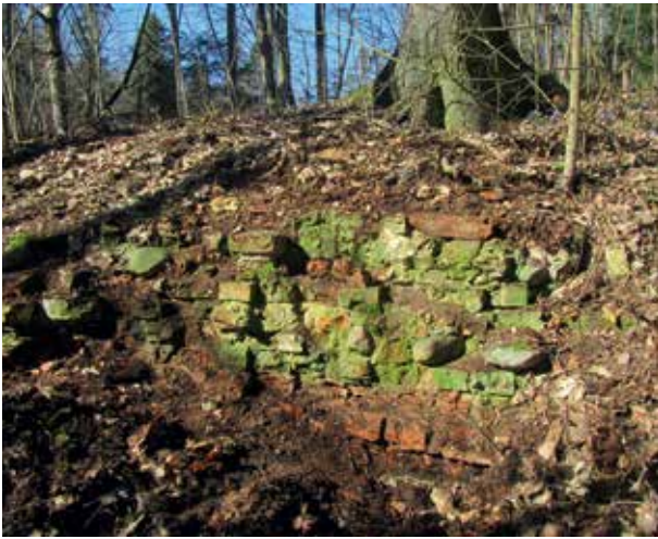
8. Verkių parke ant kalvelės rasto mūrinio pastato (greičiausiai – Vienybės bažnyčios) griuvėsių fragmentas, 2017

Fragment of the ruins of a brick building (probably the Unity Church) found on a hill in the Verkiai park