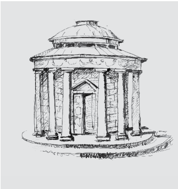
9. Antrosios parko altanos hipotetinė rekonstrukcija, dail. Gintaras Palemonas Janonis, 2017, LATGA, Vilnius 2018

Fragment of the ruins of a brick building (probably the Unity Church) found on a hill in the Verkiai park