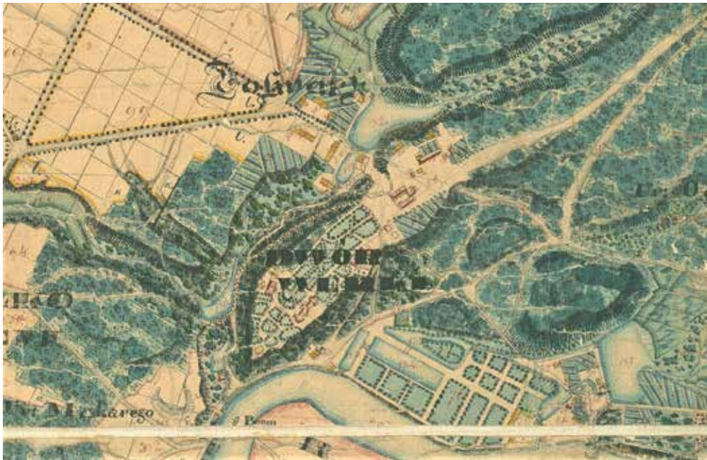
3. Verkių dvaro teritorija, XIX a. pradžios Vilniaus apylinkių žemėlapis fragmentas, in: Lietuvos XVII–XIX a. pradžios ikonografijos ir kartografijos šaltiniai Švedijoje , sudarė Ernestas Vasiliauskas, Gintautas Zabiela, Klaipėda: Klaipėdos universiteto leidykla, 2013

Verkių estate territory, detail of a map of Vilnius environs from the early 19th c.