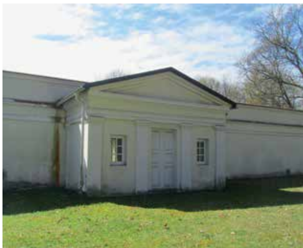
6. XVIII a. pab. pastatyto šiltnamio fragmentas, Rūtos Janonienės nuotrauka, 2017 Detail of a hothouse built in the late 18th c.

(vynuogių, persikų, abrikosų) iš Verkių ir Vingio medelynų atsiųsti į Kretingą, kurioje įsteigtas naujas vaismedžių sodas 57 . 1803 m. inventoriuje minimi du didesni ir vienas mažesnis mūriniai šiltnamiai – visi su durimis, be langų, iš dalies su langinėmis, viduriniame buvo vasarinės gyvenamos patalpos; šiltnamiai, kaip ir sodas tarp jų, aptvertas mūrine tvora 58 .