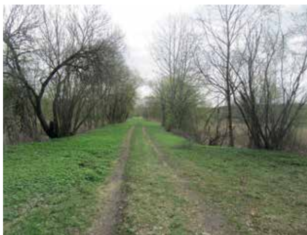
2. Pylimas tarp dviejų kanalų apatinių sodų teritorijoje, 2017