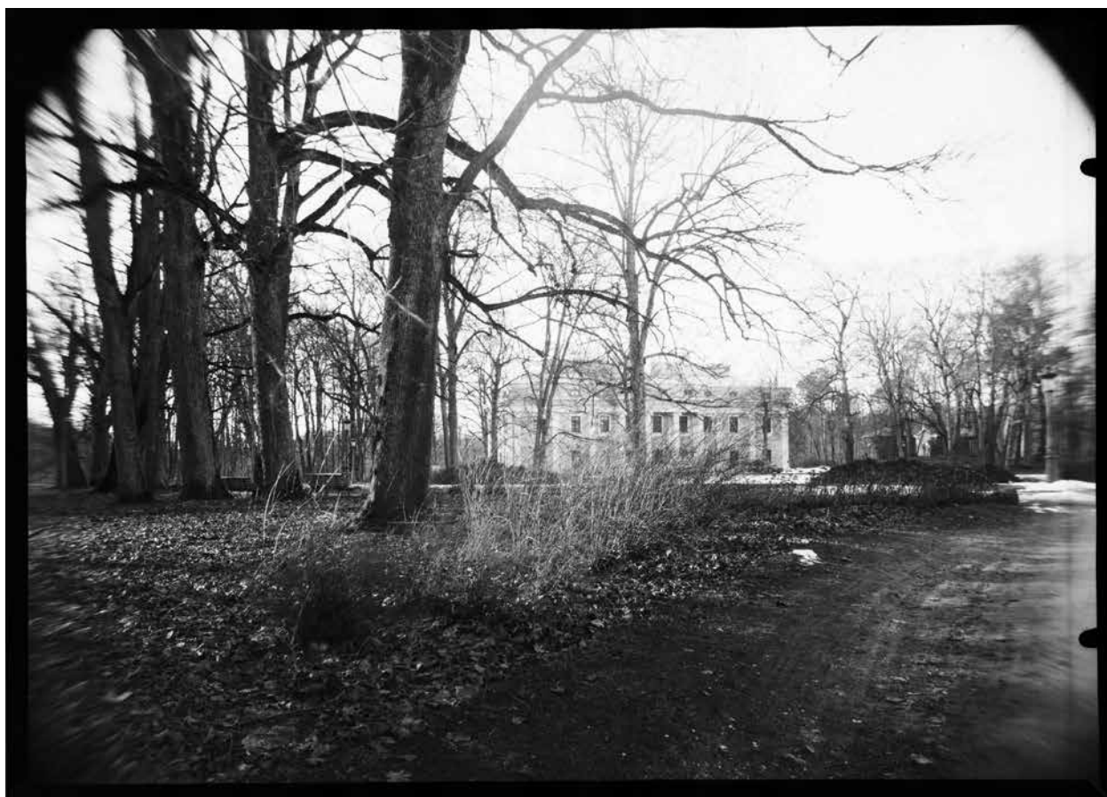
7. Verkių rūmų paradinio kiemo prieigos, fotografija, D. Labeckis, 2016

Approaches to the main courtyard of the Verkiai palace