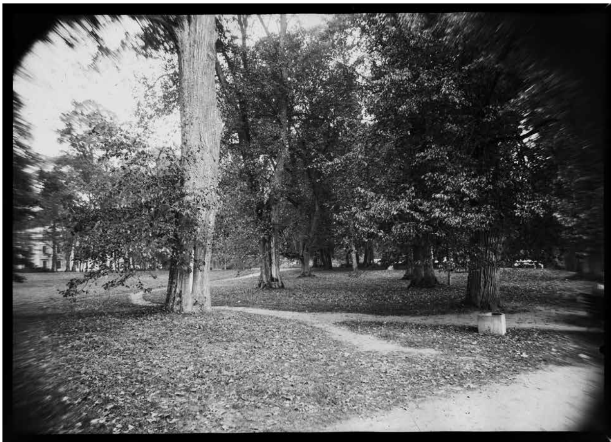
5. Liepų alėja (XVIII–XIX a. parko relikvas) Verkių parke, fotografija, D. Labeckis, 2016

Linden alley (18th c.) in the Verkiai park