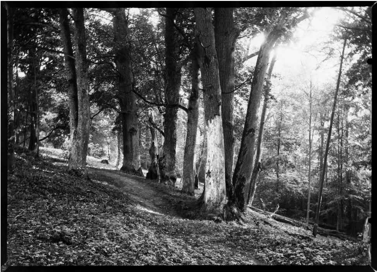
6. Ažuolų eilė Verkių parke, fotografija, D. Labeckis, 2016