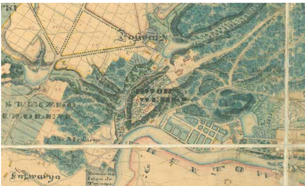
1. Verkių dvaro sodyba, 1839, plano fragmentas, iš: План местоположения в окрестности имени Верки, 1839, in: AGAD, Zbiory kartograficzne, t. 4 teka 447, nr. 2 Verkių manor estate, 1839, detail of a plan