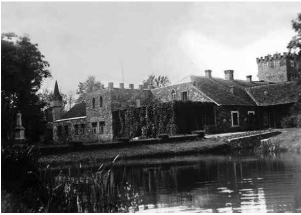
1. Burbiškio dvaro rūmai ir parkas, než. aut. nuotrauka, XX a. 4 dešimtmetis, in: Daugyvenės kultūros istorijos muziejaus-draustinio archyvas