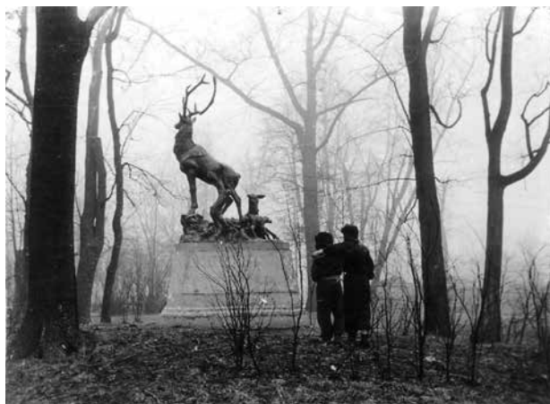
10. Elnių šeimyna Šiaulių parke, XX a. 6 dešimtmetis