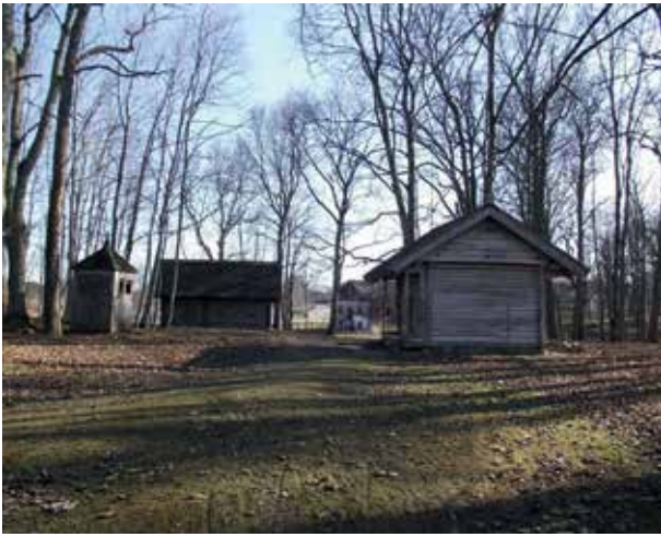
3. Aukštaitijos kaimo ekspozicija Rokiškio dvaro parke, 2013, in: Lietuvos Respublikos kultūros vertybių registras, unikalus objekto kodas 1010, FF606, [interaktyvus], [žiūrėta 2018-03-01], https://kvr.kpd.lt/#/static-heritage-search

Exhibits of an Aukštaitija village in the Rokiškis manor park