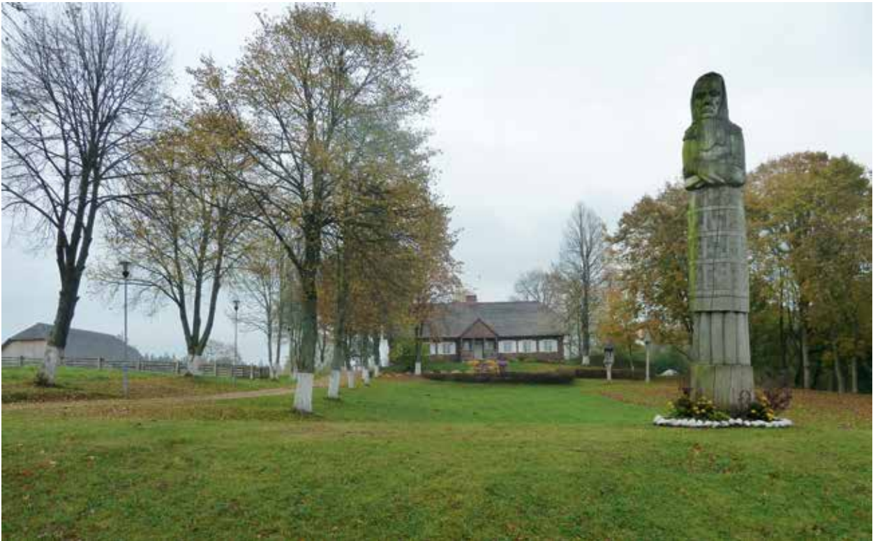
8. Rašytojos Žemaitės skulptūra Bukantės dvaro erdvėje, 2014, in: Lietuvos Respublikos kultūros vertybių registras, unikalus objekto kodas 10537, FF31, [interaktyvus], [žiūrėta 2018-03-01], https://kvr.kpd.lt/#/static-heritage-search

Statue of the writer Žemaitė in the Bukantė manor