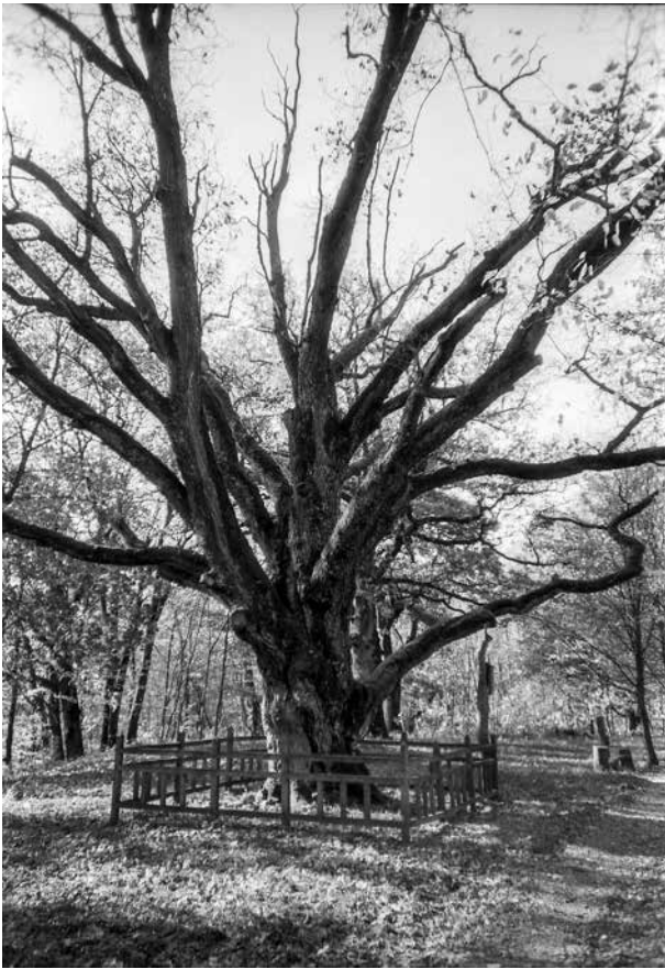
9. „Perkūno“ ąžuolas Plungės dvaro parke, Romeo Pinevičiaus nuotrauka, 1989 Perkūnas Oak in the Plungė manor park