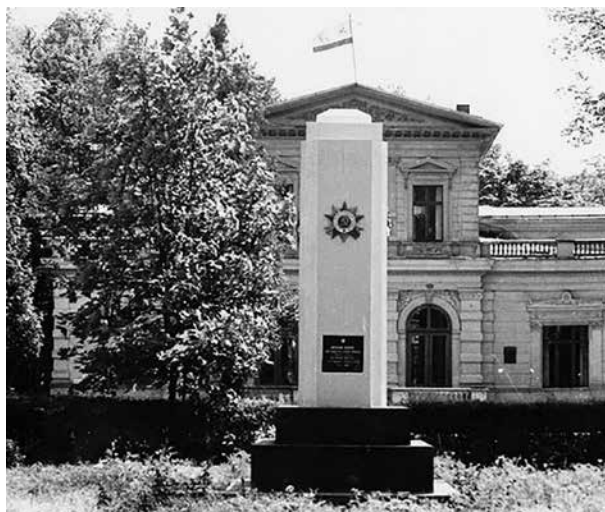
4. Paminklas žuvusiems „Didžiamajame Tėvynės kare“ Švėkšnos dvaro parterėje, sovietmetis

Monument to the Great Patriotic War soldiers in the Švėkšna manor parterre