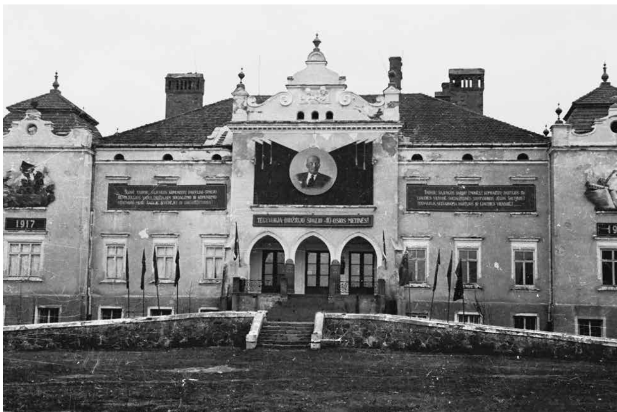
2. Rokiškio dvaro rūmai, 1957, in: Rokiškio krašto muziejus, RKM F, 4769, [interaktyvus], [žiūrėta 2018-03-01], www.limis.lt.a