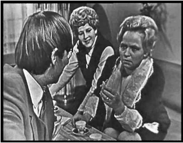
3. Televizijos seriale „Petraičių šeimoje“ herojė: „Juk ne visiems sodas – pasipelnymo šaltinis. Daugeliui – parama“. Rež. Galina Dauguvietytė, 1971

Heroine of the TV series The Petraitis Family : “Not everyone sees a collective garden as a source of financial gain. For many people it provides sustenance”, 1971