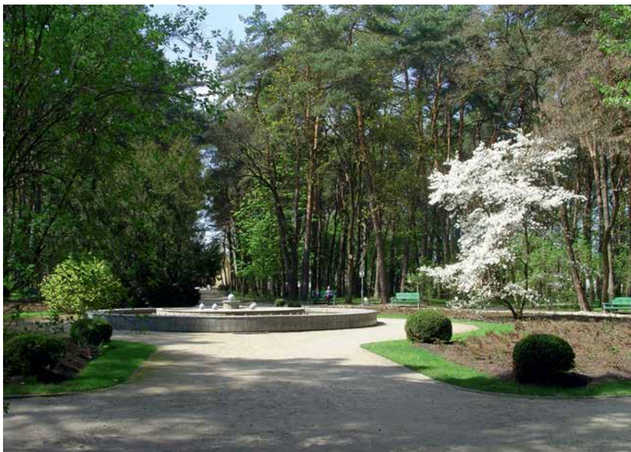
5. Žydinti japoninė magnolija, 2017