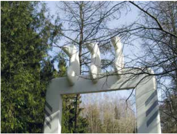
7. Vytauto Naručio skulptūra Vartai (1985), Margaritos Janušonienės nuotrauka, 2017