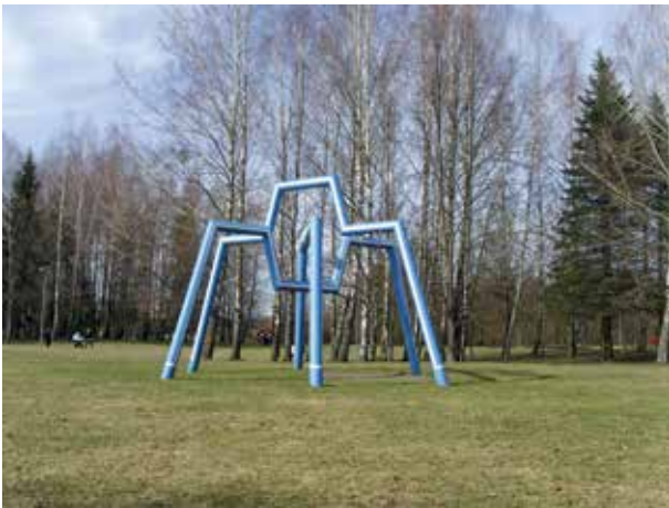
8. Antano Balkės skulptūra Karališkasis voras (1985), 2017