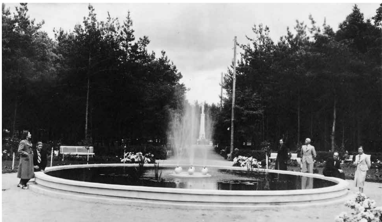
4. Alytaus miesto sodo fontanas. Tolumoje – paminklas Laisvės angelas , autorius nežinomas, 1937–1939, in: Alytaus kraštotyros muziejaus archyvo

Fountain in the Alytus City Garden. The Freedom Angel monument is in the distance, 1937–1939