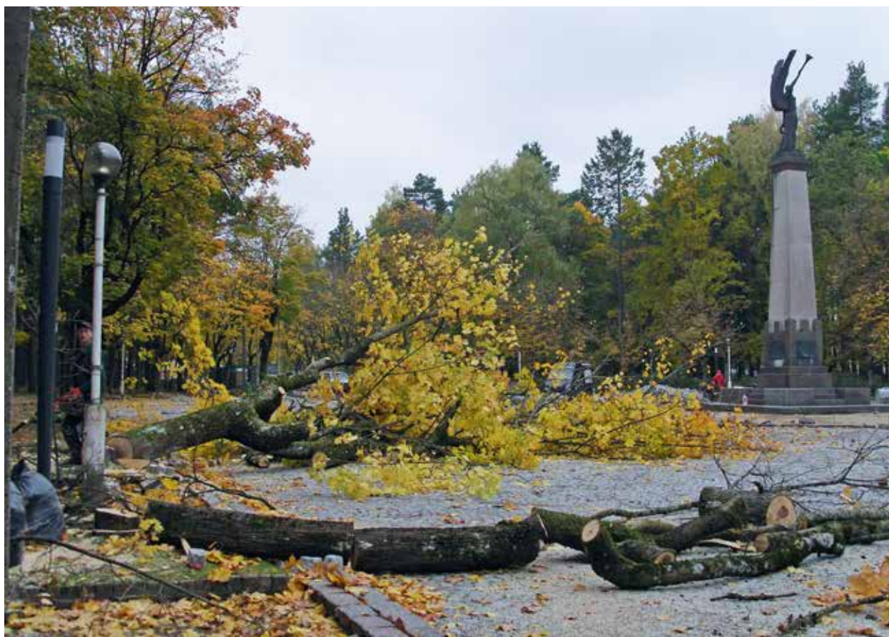
6. Iškirsti klevai „Laisvės angelo“ aikštėje, Margaritos Janušonienės nuotrauka, 2012

Cut-down maple trees in the Freedom Angel Square