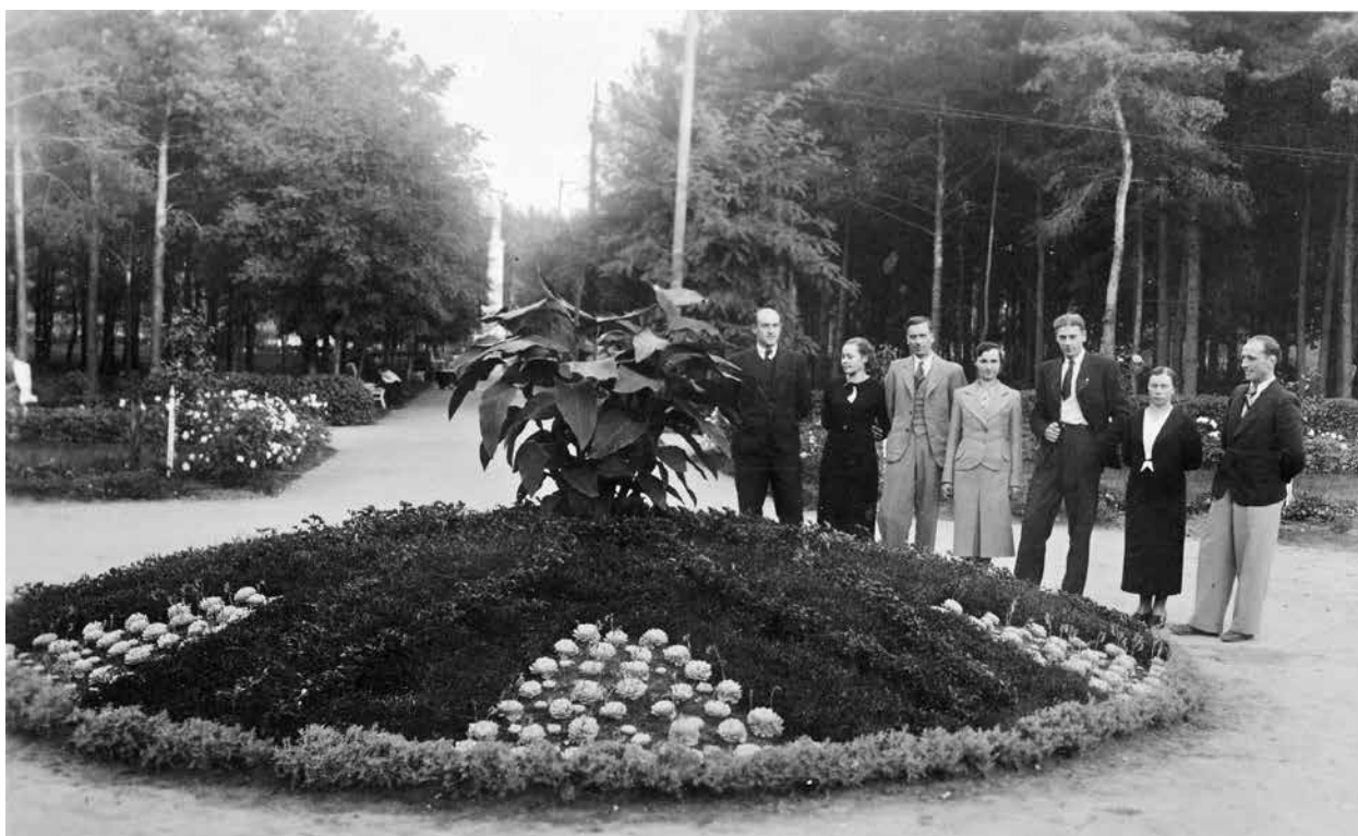
2. Centrinė Alytaus miesto sodo klomba, autorius nežinomas, iki 1935, in: Alytaus kraštotyros muziejaus archyvas

Central flower bed of the Alytus City Garden, before 1935