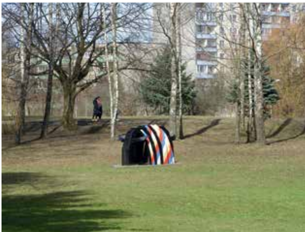
9. Virginijos Babušytės-Venskūnienės skulptūra Vaivorykštė (1985), Margaritos Janušonienės nuotrauka, 2017, LATGA, Vilnius 2018 Virginija Babušytė-Venskūnienė's sculpture Rainbow