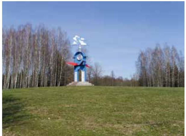
11. Naglio Nasvyčio skulptūra Aeronautikos istorija , Margaritos Janušonienės nuotrauka, 2017, LATGA, Vilnius 2018 Naglis Nasvytis's sculpture The History of Aeronautics .