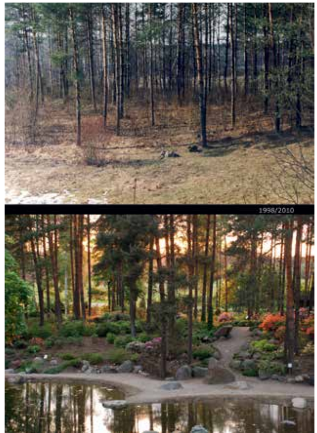
7 a, b VU Botanikos sodo Kairėnuose teritorijos pokyčiai, 1998–2010

Changes in the territory of the Botanical Garden of Vilnius University in Kairėnai