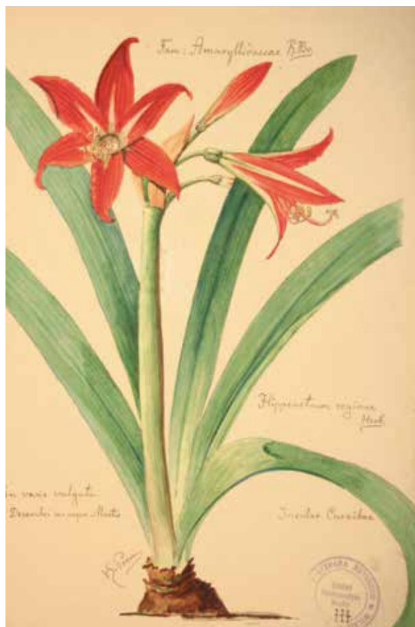
5. a, b, c SBU botanikos sodo inspektoriaus Konstantino Proszynskiego Botanikos sodo augalų piešiniai, 1919–1936, in: Vilniaus universiteto herbariumas, Silvos Žilinskaitės nuotrauka, 2008

Plant drawings by the inspector of the Botanical Garden of Stephen Báthory University Konstantin Proszynski, 1919–1936