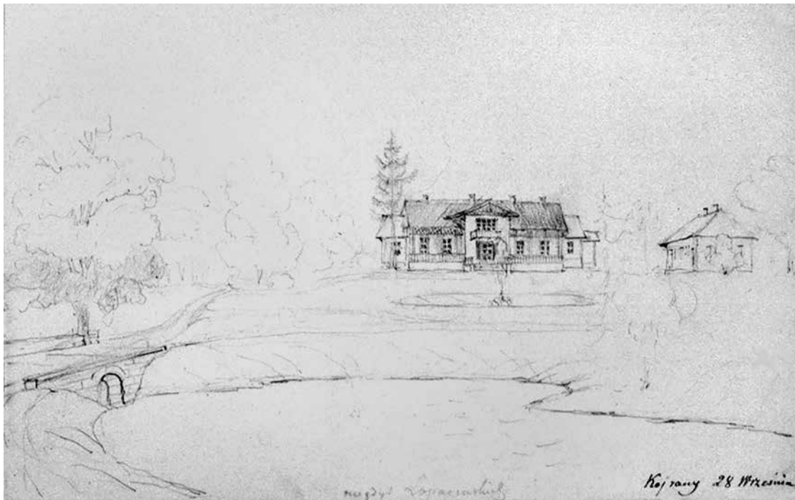
6. Napoleonas Orda, Kairėnų dvaro rūmai , 1875–1877, Krokuvos nacionalinis muziejus, in: Vytautas Levandauskas, Renata Vaičikonytė-Kepežinskienė, Napoleonas Orda, senosios Lietuvos architektūros peizažai , Vilnius: Vilniaus dailės akademijos leidykla, 2006, 193 il.

Napoleon Orda, Kairėnai manor , 1875–1877