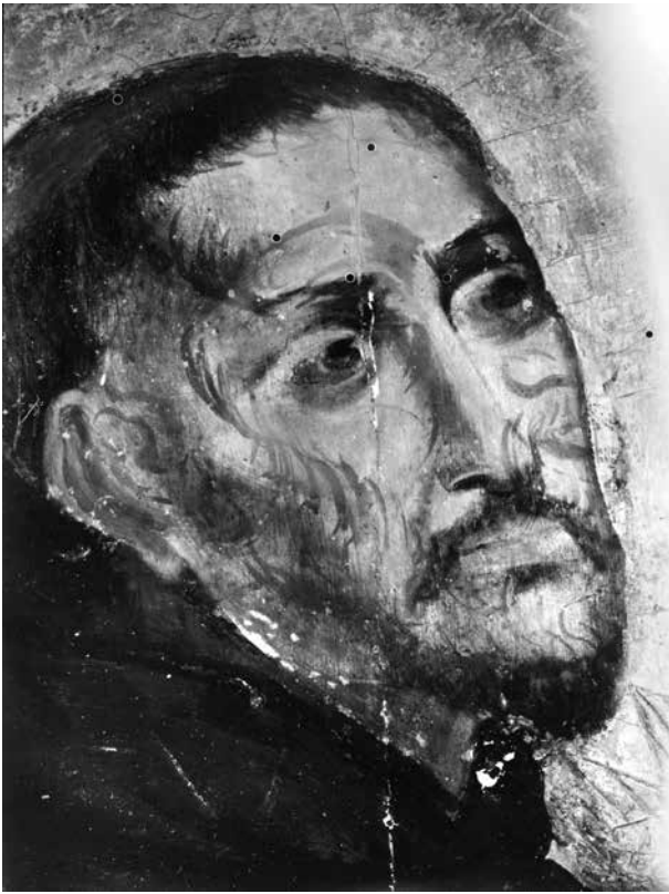
8. Sapiegų Dievo Motina, fragmentas (UV spinduliuotė), 1985

Painting Our Lady of the Sapiehas , detail (UV radiation)