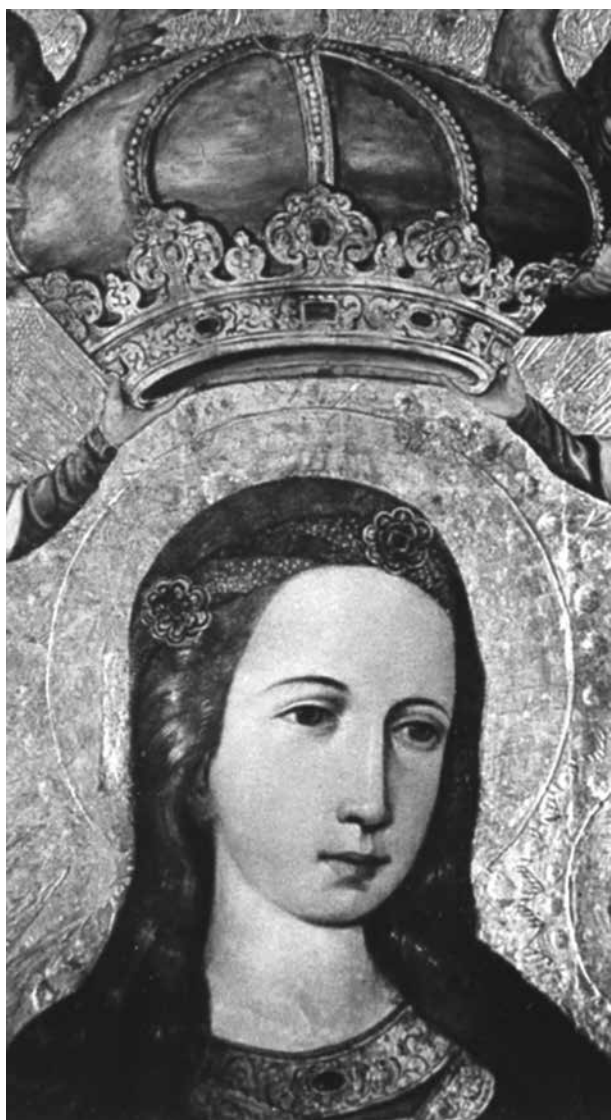
6. Sapiegų Dievo Motina, fragmentas, 1935

Painting Our Lady of the Sapiehas , detail