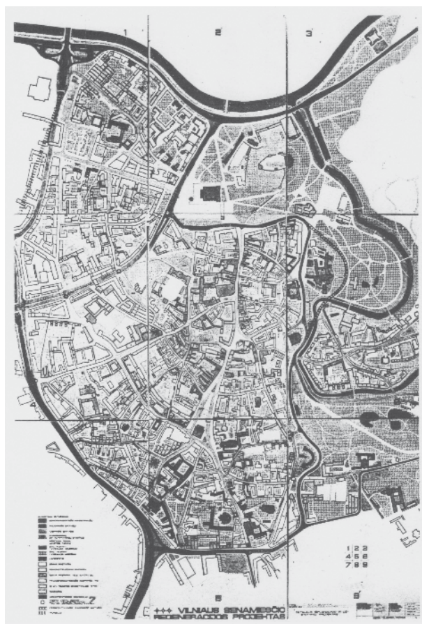
3. Vilniaus senamiesčio 1974 metų regeneracijos projekto sprendiniai, in: Glemža Jonas, „The revitalization of the Old Town of Vilnius and its problems“, in: ICOMOS Information , Italy, 1989, Nr. 2, p. 25

Propositions of the regeneration project of the Vilnius Old Town of 1974