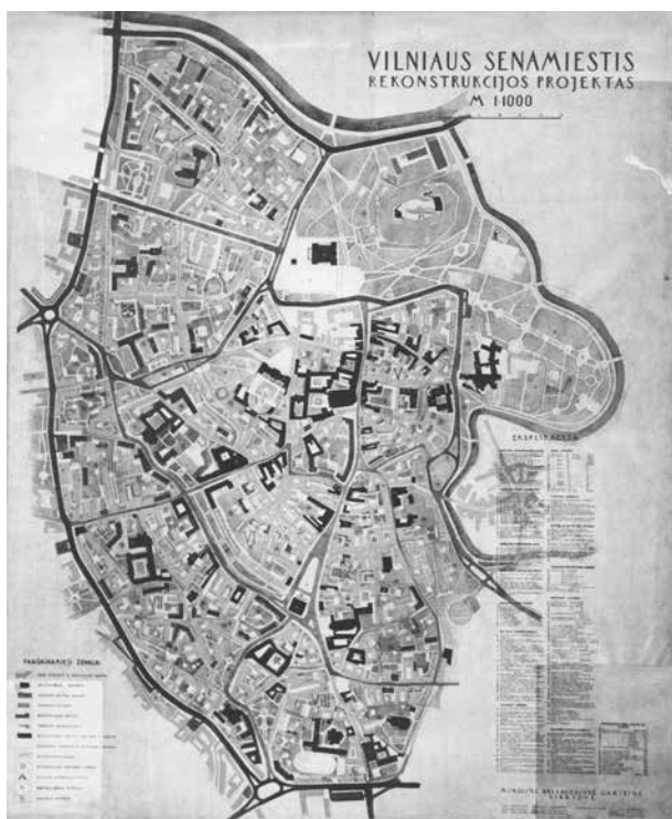
2. Vilniaus senamiestio 1958 metų rekonstrukcijos projekto sprendiniai, in: MRGD, Vilniaus senamiestio regeneracijos projektas , 1958, Vilnius, in: VAA, f. 2, 101–9

Propositions of the reconstruction project of the Vilnius Old Town of 1958