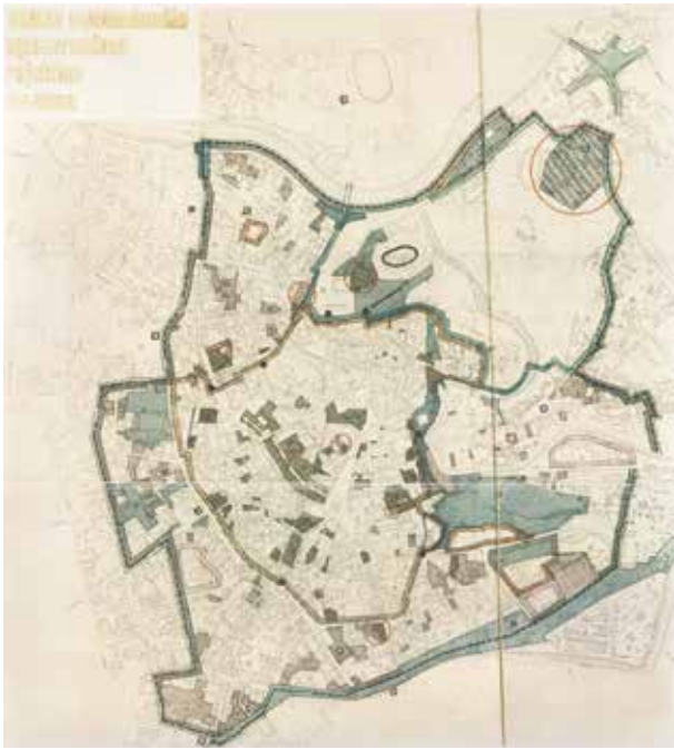
5. Senamiesčio regeneravimo koncepcijos schema, in: Vilniaus senamiesčio regeneravimo projektas (1988–1992), samprata (konceptija) ir sklypų planas , AB „Paminklų restauravimo institutas“, 1997, Vilnius, p. 40

Scheme of the concept of regeneration of the Old Town