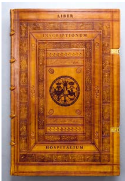
1. Liber inscriptionum hospitalium / Lankytojų knyga, viršutinis kietviršis, XVI a. knygos įrišo rekonstrukcija, Lenkija–Lietuva, aut. Cezar Poliakevič, 2010

Liber inscriptionum hospitalium / Visitors' book, upper board. Reconstruction of a 16 th century binding, Poland – Lithuania. Cezar Poliakevič, 2010