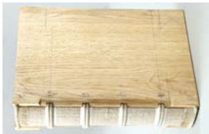
9. XV a. struktūrinis knygos įrišo atviro tipo rekonstrukcijos modelis, aut. Ramunė Kleinovaitė, Sigitas Tamulis, 2017

pen-type structural reconstruction model of a 15 th -century binding. Ramunė Kleinovaitė, Sigitas Tamulis, 2017