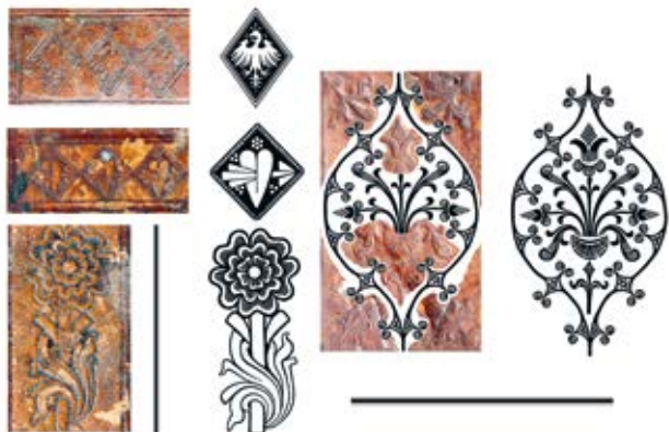
6. XV a. knygos viršelio įspaudų grafinių vaizdų atkūrimas, aut. Vytautas Valinskas, Raimondo Malaiškos nuotrauka

Reconstruction of graphic images of the embossing of a 15 th -century book cover. Vytautas Valinskas