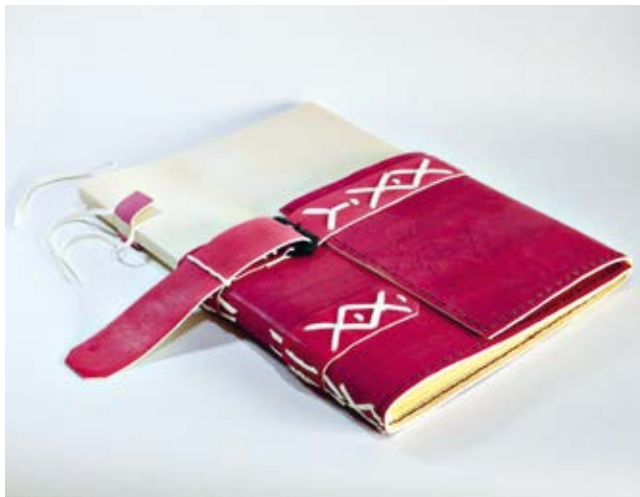
4. Apskaitos knyga, XIV a. archyvinis knygos įrišo pusiau atviro tipo struktūrinis modelis su skersiniu pjūviu, Italija, aut. Ieva Rusteikaitė, 2017

Ledger book. Cutaway archival structural model of a 14 th -century binding with a cross- section. Italy. Ieva Rusteikaitė, 2017