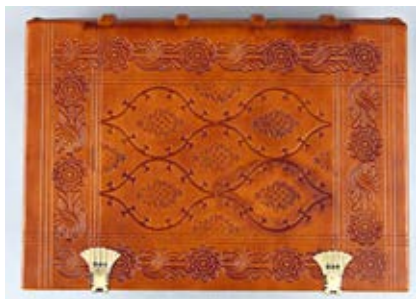
11. XV a. knygos įrišo rekonstrukcijos modelis, viršutinis kietviršis, aut. Ramunė Kleinovaitė, Sigitas Tamulis, 2017

Closed-type structural reconstruction model of a 15 th -century binding. Ramunė Kleinovaitė, Sigitas Tamulis, 2017