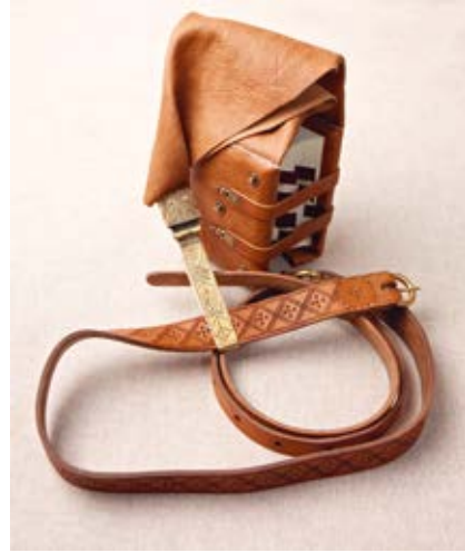
3. Knyga-kapšas, XV a. knygos įrišo rekonstrukcijos modelis, Vokietija, aut. Sigitas Tamulis, 2015; Knygos segtuvai ir apkalai, aut. Marius Žuramskas

Girdle book. Open-type structural reconstruction model of a 15 th -century binding, Germany. Sigitas Tamulis, 2015