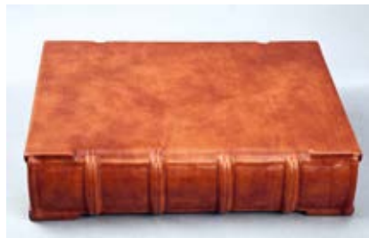
10. XV a. knygos įrišo uždaro tipo struktūrinis rekonstrukcijos modelis, aut. Ramunė Kleinovaitė, Sigitas Tamulis, 2017

pen-type structural reconstruction model of a 15 th -century binding. Ramunė Kleinovaitė, Sigitas Tamulis, 2017