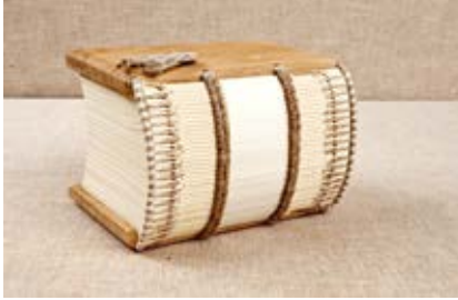
2. Knyga-kapšas, XV a. knygos įrišo atviro tipo struktūrinis rekonstrukcijos modelis, Vokietija, aut. Sigitas Tamulis, 2015

Girdle book. Open-type structural reconstruction model of a 15 th -century binding, Germany. Sigitas Tamulis, 2015