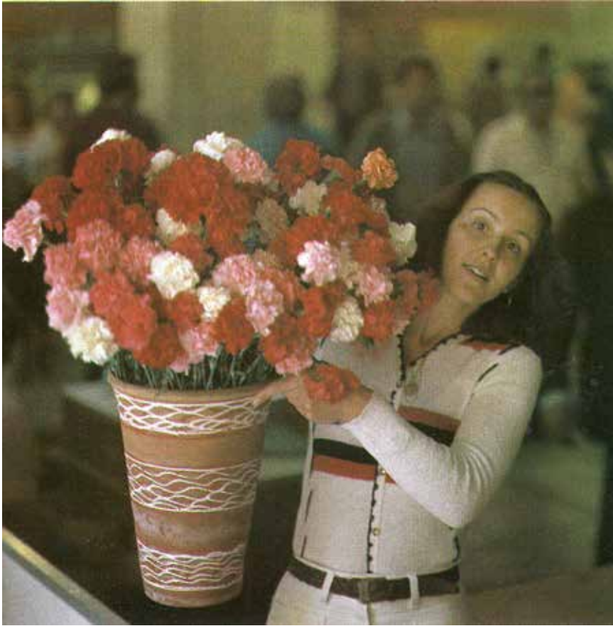
6. Lazdynų gyvenamajame rajone, in: Vilnius , sud. Algirdas Gaižutis, Algirdas Grubevičius, Vilnius: Mintis, 1985, il. 106, p. 117