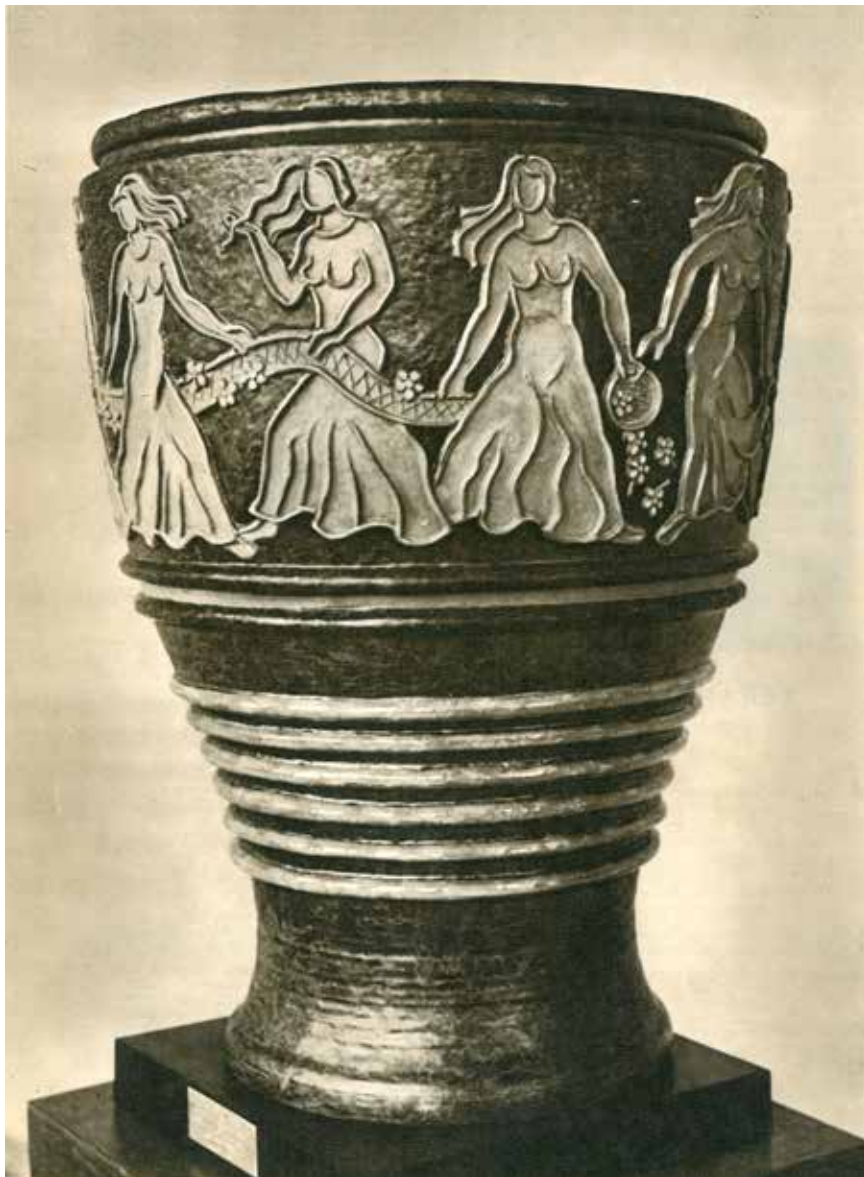
1. Liudvikas Strolis, Flora , in: Taikomoji-dekoratyvinė dailė , sud. T. Adomonis, Vilnius: Mintis, 1965, il.1