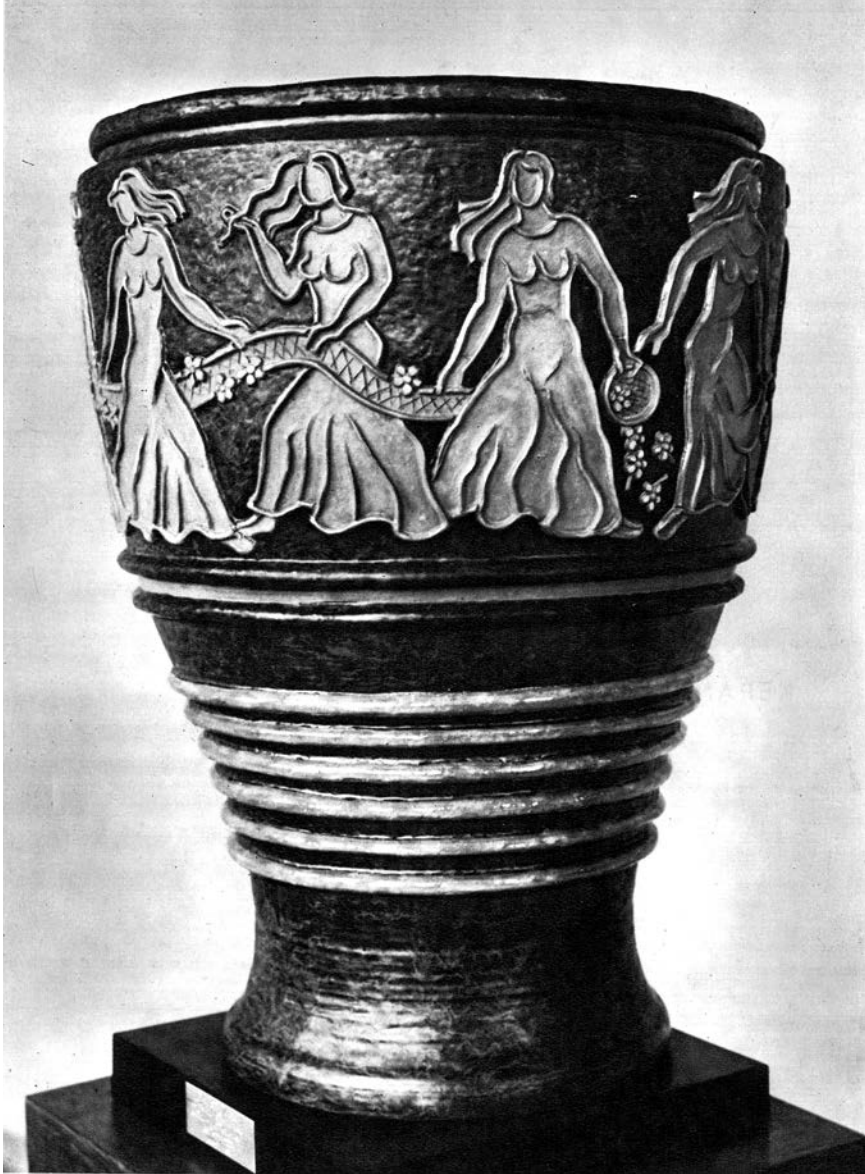
1. Liudvikas Strolis, Flora , in: Taikomoji-dekoratyvinė dailė , sud. T. Adomonis, Vilnius: Mintis, 1965, il.1