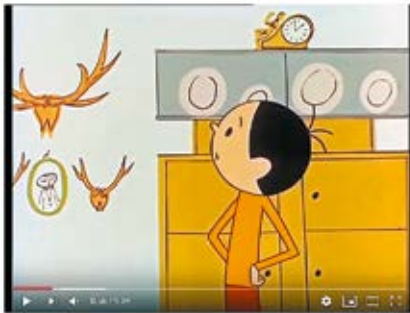
BOLEK I LOLEK - "KRÓL PUSZCZY" 12 992 peržiūros

Stanisław Dulz, Robinson , still from the animated cartoon series Bolek i Lolek , 1962–1964