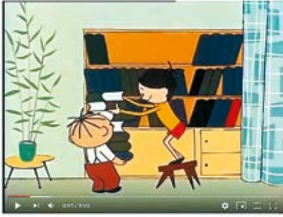
BOLEK I LOLEK - "ROBINSON" 55 857 views