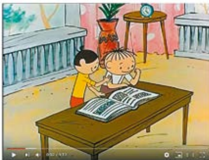
Bolek i Lolek - Zaklęty Zamek 1 232 333 views