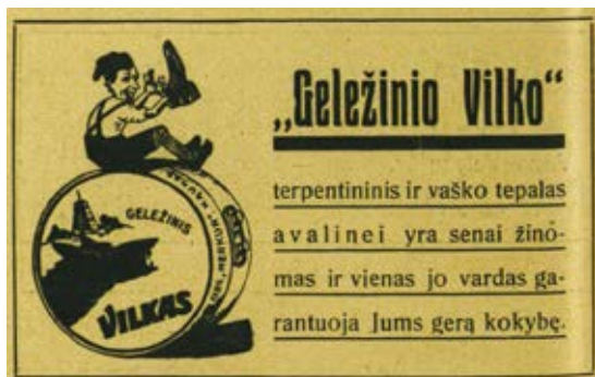
7. Fabriko „Merkur“ batų tepalo Geležinis vilkas reklama, Mūsų Vilnius , 1931, nr. 9

Advertisement of the shoeshine Iron Wolf produced by the Merkur factory, Mūsų Vilnius , 1931, no. 9