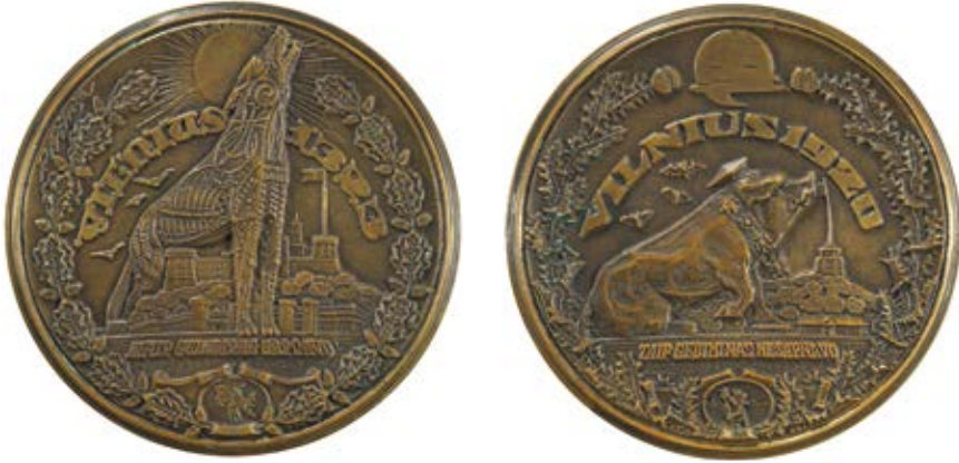
6. Petro Rimšos medalis Vilnius 1323/1920, 1927 , bronzos, Lietuvos meno pažinimo centro „Tartle“ kolekcija