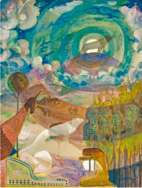
5. Kajetonas Sklėrius, Gedimino sapnas , 1917, akvarelė, Nacionalinis M. K. Čiurlionio dailės muziejus

Gediminas's Dream , 1850–1855, oil on canvas, National Museum in Warsaw