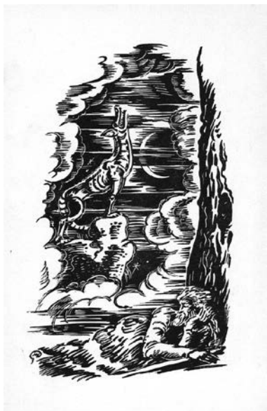
8. Mstislavo Dobužinskio iliustracija Balys Sruogos poemai Giesmė apie Gediminą , Kaunas, „Sakalo“ leidykla, 1938

Advertisement of the shoeshine Iron Wolf produced by the Merkur factory, Mūsų Vilnius , 1931, no. 9