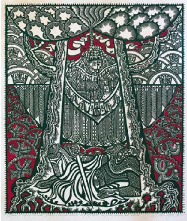
10. Aldona Skirutytė, Gedimino sapnas iš ciklo Senasis ir naujasis Vilnius , 1973, spalvotas linoražinys, ARS VIA aukciono kolekcija

Gediminas's Dream from the series Old and New Vilnius , 1973, colour linocut, collection of the ARS VIA Auction