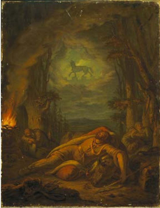
2. Aleksander Lesser; Gedimino sapnas , 1840–1860, drobė, aliejus, Varšuvos nacionalinis muziejus

Gediminas's Dream , 1840–1860, oil on canvas, National Museum in Warsaw