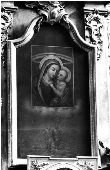
16. Švč. Mergelės Marijos Gerosios Patarėjos paveikslas, KPC