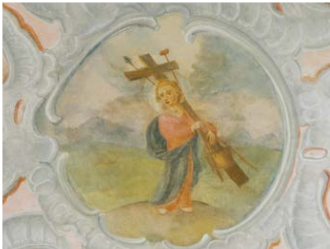
7. Motiejus Sluččianskis, Pasijų Vaikelis, Vilniaus Šv. Teresės bažnyčios šoninės koplyčios skliauto tapyba restauravimo metu, fragmentas, Tojanos Račiūnaitės nuotrauka, 2022

Infant of the Passion, paintings on the vault of the side chapel of St Theresa's Church in Vilnius during conservation, detail