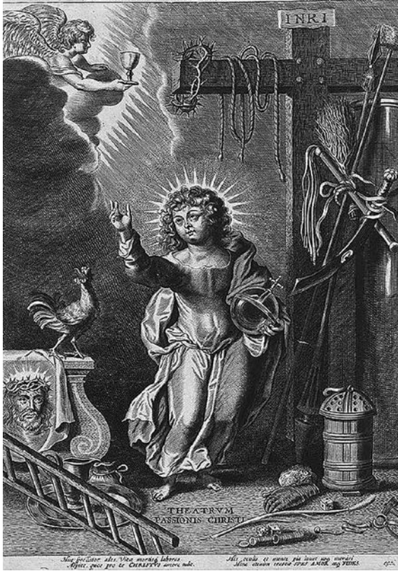
4. Hieronim Wierix, Theatrum Arma Christi , XVII a. I p., vario raižinys, Britų muziejus

Theatrum Arma Christi , 1st half 17th c., copper engraving, British Museum