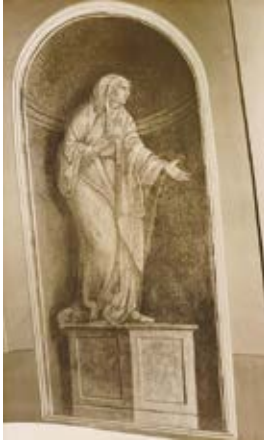
18. Šv. Mergelė Marija, Vilniaus Šv. Teresės bažnyčios Nukryžiuotojo koplyčios sienų tapyba, KPC

The Blessed Virgin Mary, wall painting in the Chapel of the Crucified Christ of St Theresa's Church in Vilnius