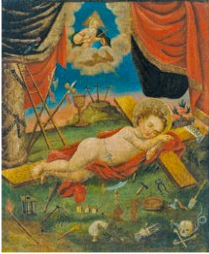
6. Nežinomas dailininkas, Kūdikėlis Jėzus, miegantis ant kryžiaus , XVIII a., drobė, aliejus, LNDM

Unknown artist, Infant Jesus sleeping on the cross , 18th c., oil on canvas