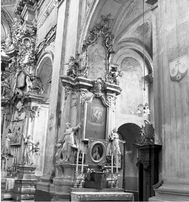
14. Švč. Mergelės Marijos Gerosios Patarėjos paveikslas perkeltas į Vilniaus Šv. Teresės bažnyčios pagrindinės navos šoninį altorių

Painting of Our Lady of Good Counsel transferred to the side altar of the main nave of St Theresa's Church in Vilnius