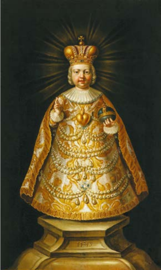
3. Prahos Kūdikelis Jėzus, Pietų Vokietija, XVIII a. I p., drobė, aliejus, © Diözesanmuseum Freising, Walterio Bayerio nuotrauka

Infant Jesus of Prague, South Germany, 1st half 18th c., oil on canvas