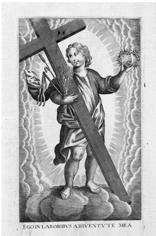
9. Peter Overadt, Et in laboribus a iuventute mea , vario raizinyš, Wolfenbütteleio Herzogo Augusto bibliotekos Wolfenbütteleio grafikos rinkinyš

Et in laboribus a iuventute mea , copper engraving. Collections of graphic art, Rijksmuseum, Amsterdam