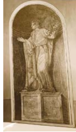
19. Šv. Jonas Evangelistas, Vilniaus Šv. Teresės bažnyčios Nukryžiuotojo koplyčios sienų tapyba, KPC

The Blessed Virgin Mary, wall painting in the Chapel of the Crucified Christ of St Theresa's Church in Vilnius