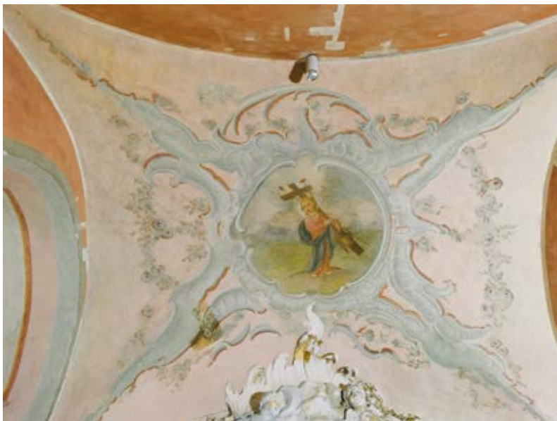
2. Motiejus Sluščianskis, Pasijų Vaikelis, Vilniaus Šv. Teresės bažnyčios šoninės koplyčios skliauto tapyba po restauravimo, 2020