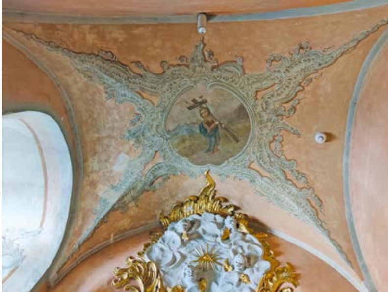
1. Motiejus Sluščianskis, Pasijų Vaikelis, Vilniaus Šv. Teresės bažnyčios šoninės koplyčios skliauto tapyba prieš restauravimą, Indrės Valkiūnienės nuotrauka, 2020