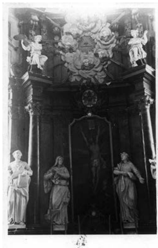
11. Vilniaus Šv. Kotrynos bažnyčios Dievo apvaizdos koplyčia, LNDM Chapel of the Divine Providence of St Theresa's Church in Vilnius

nesimato. Remdamiesi šia analogija, galime daryti prielaidą, kad ir Vilniaus Šv. Teresės bažnyčios Dievo Apvaizdos altoriaus pagrindinėje nišoje kabėjo ar stovėjo pasijinės ikonografijos atvaizdas 63 .