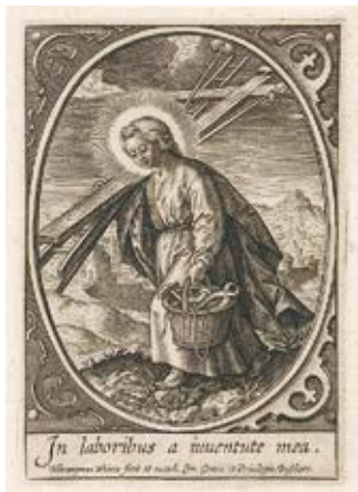
8. Hieronim Wierix, Et in laboribus a iuventute mea , vario raizinyš, Amsterdamo Rijksmuzeum grafikos rinkiniai

Et in laboribus a iuventute mea , copper engraving. Collections of graphic art, Rijksmuseum, Amsterdam