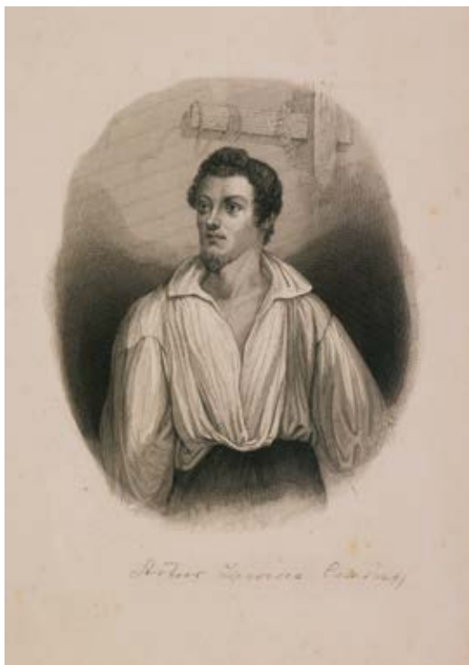
7. Artūras Zaviša , Antonio Oleszczyński (Nitano) plieno raizinyms pagal Napoleon Ylakavičiaus piešinį, in Michał Chodźka, Dziesięć obrazów z wyprawy do Polski 1833 r. , Paryż, 1841, Varšuvos nacionalinė biblioteka (Biblioteka Narodowa w Warszawie), G.722/Sz

Józef Zaliwski , steel engraving by Antoni Oleszczyński (Nitan) after Napoleon Iłhakowicz's drawing, in Michał Chodźko, Dziesięć obrazów z wyprawy do Polski 1833 r. , Paryż, 1841, National Library of Poland