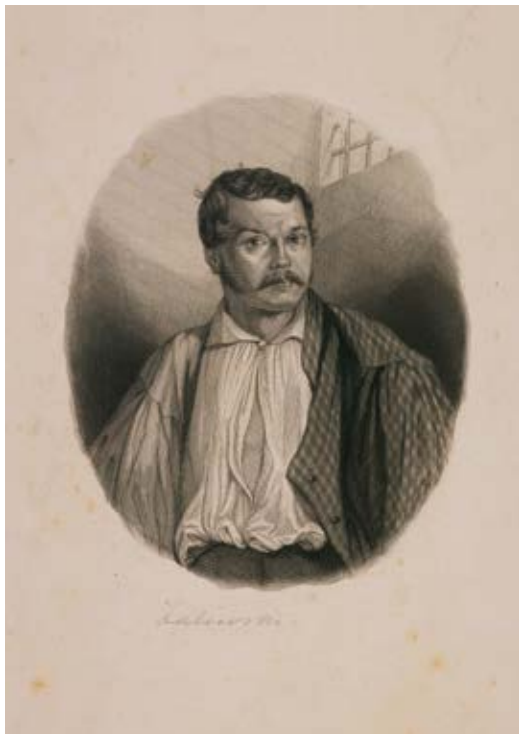
6. Juozapas Zaliuskis , Antonio Oleszczyński (Nitano) plieno raizinyms pagal Napoleon Ylakavičiaus piešinį, in Michał Chodźka, Dziesięć obrazów z wyprawy do Polski 1833 r. , Paryż, 1841, Varšuvos nacionalinė biblioteka (Biblioteka Narodowa w Warszawie), G.722/Sz

Józef Zaliwski , steel engraving by Antoni Oleszczyński (Nitan) after Napoleon Iłhakowicz's drawing, in Michał Chodźko, Dziesięć obrazów z wyprawy do Polski 1833 r. , Paryż, 1841, National Library of Poland