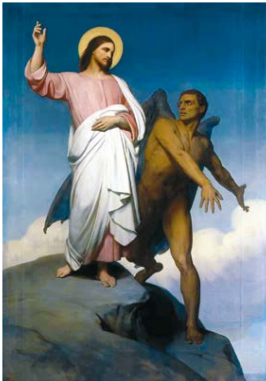
3. Ary Scheffer, Kristus, gundomas šėtono , https://lt.m.wikipedia.org/wiki/Vaizdas:Ary_Scheffer_-_The_Temptation_of_Christ_(1854).jpg