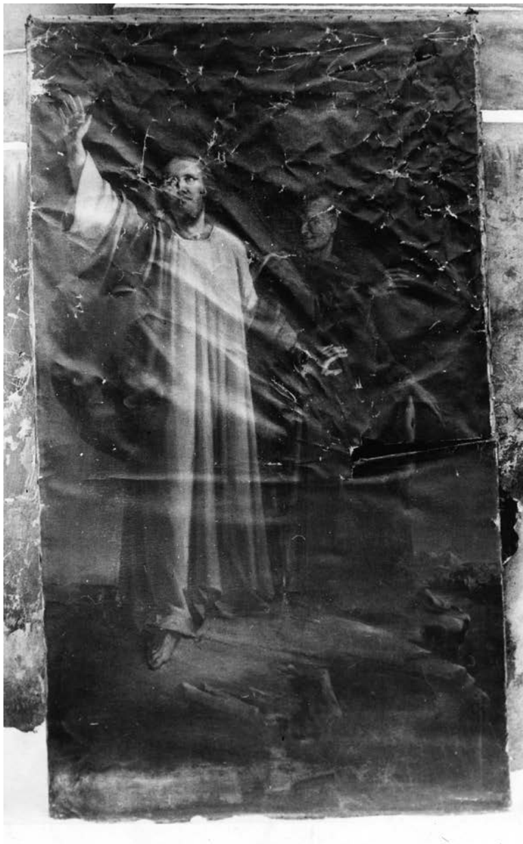
1. Mečislovas Sakalauskas, Napoleono Ylakavičiaus paveikslas Kristaus gundymas nuotrauka, 1968, Lietuvos nacionalinis dailės muziejus

Photo of Napoleon Ilakowicz's painting The Temptation of Christ , 1968, Lithuanian National Museum of Art