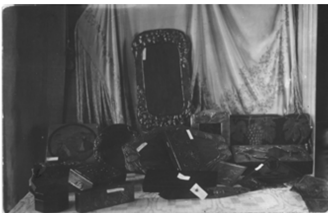
9. Moterų dailės darbų mokyklos moksleivių metalo plastika ir odos dirbiniai, XX a. 4 deš. pr.

Textile works by the Women's Arts and Crafts School graduates, 1930s