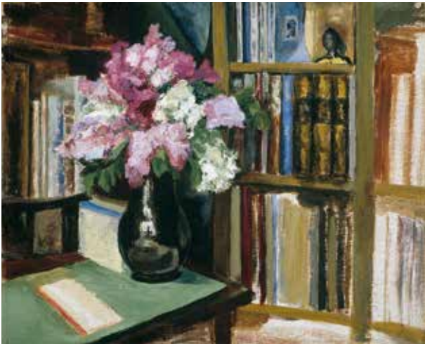
6. Interjeras su knygomis ir vaza , apie 1934–1936, drb., al., 49×59, Rasos Ramanavičienės nuos., Kaunas

Interior with books and vase , c. 1934–1936