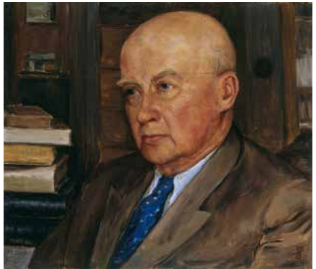
10. Konstantino Jablonskio portretas , apie 1954–1959, drb., al., 61×71, Augio Rimanto nuos., Vilnius Konstantinas Jablonskis' portrait , c. 1954–1959