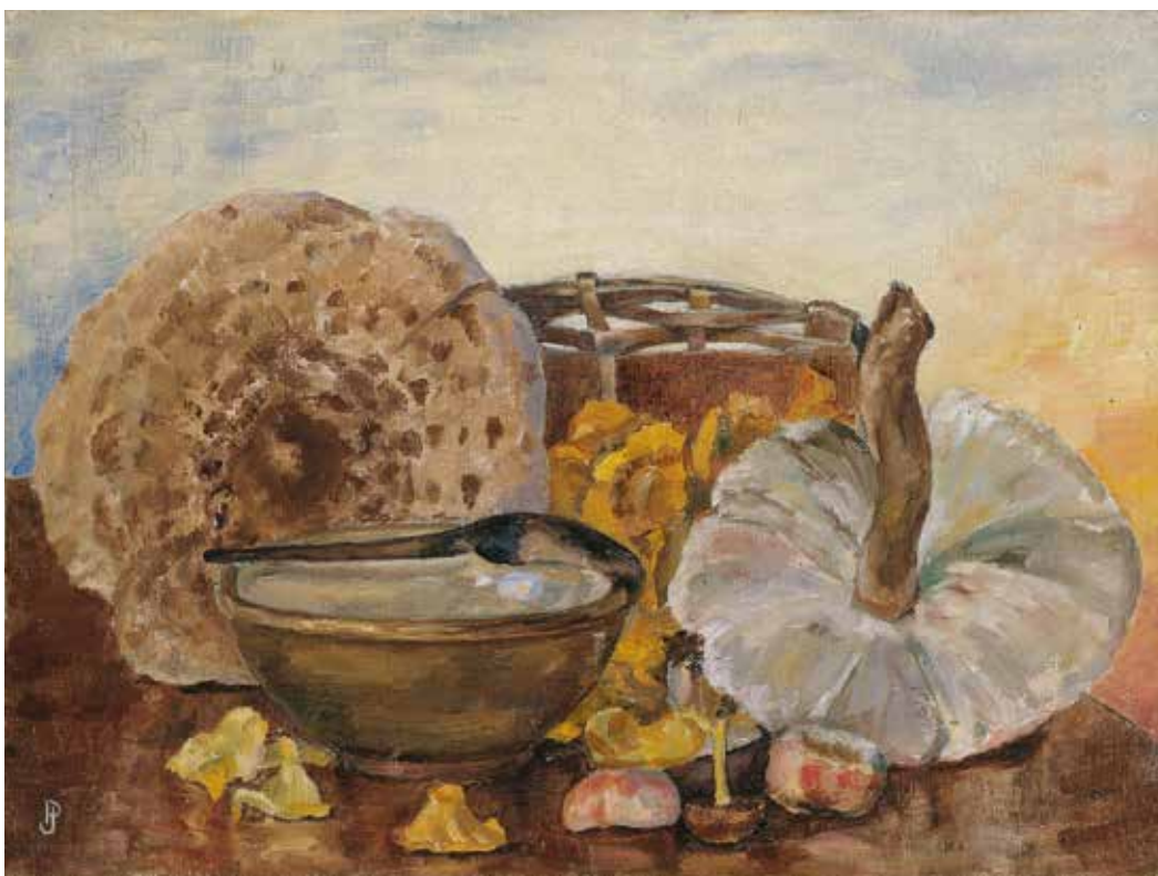
2. Natiurmortas su grybais ir dubeniu , apie 1934–1938, drb., al., 30×40, Eglės Lukėnaitės-Griciuvienės nuos., Vilnius

Still life with mushrooms and bowl , c. 1934–1938