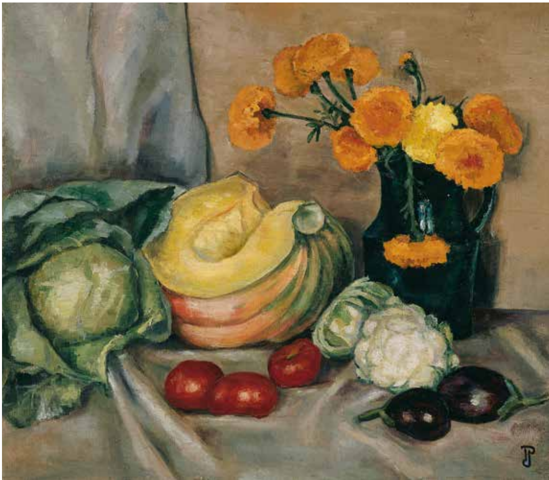
3. Natiurmortas su daržovėmis ir qsočiu , apie 1934–1938, drb., al., 70×80, Eglės Lukėnaitės-Griciuvienės nuos., Vilnius

Still life with vegetables and pitcher , c. 1934–1938