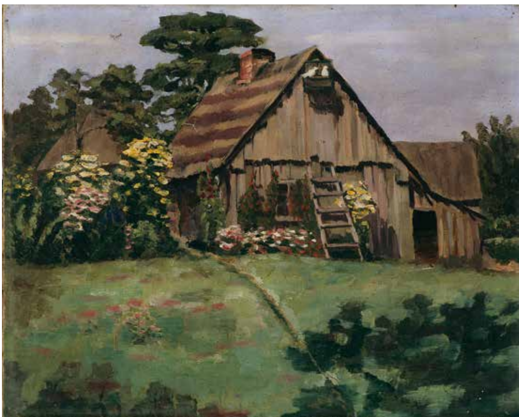
4. Sodyba , apie 1933, drb., al., 40×50, Eglės Lukėnaitės-Griciuvienės nuos., Vilnius