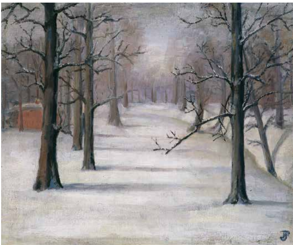
5. Žiemos ramybė , apie 1936–1938, drb., al., 50×60, Eglės Lukėnaitės-Griciuvienės nuos., Vilnius