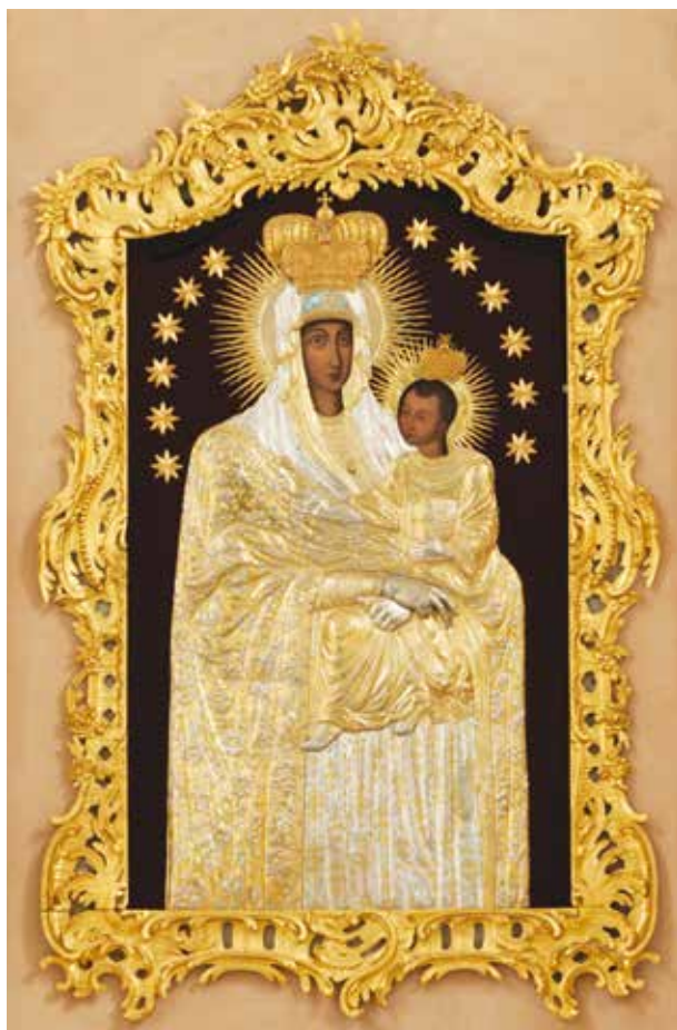
4. Šiluvos Švč. Mergelės Marijos paveikslas, 2011, Vytauto Balčyčio nuotrauka Šiluva Virgin Mary painting

Kitų unitiškų ikonų kartočių taip pat nenurodyta 102 . Taigi Palenkės unitų cerkvėse populiariausios buvo katalikiškų kultinių atvaizdų kartotės.