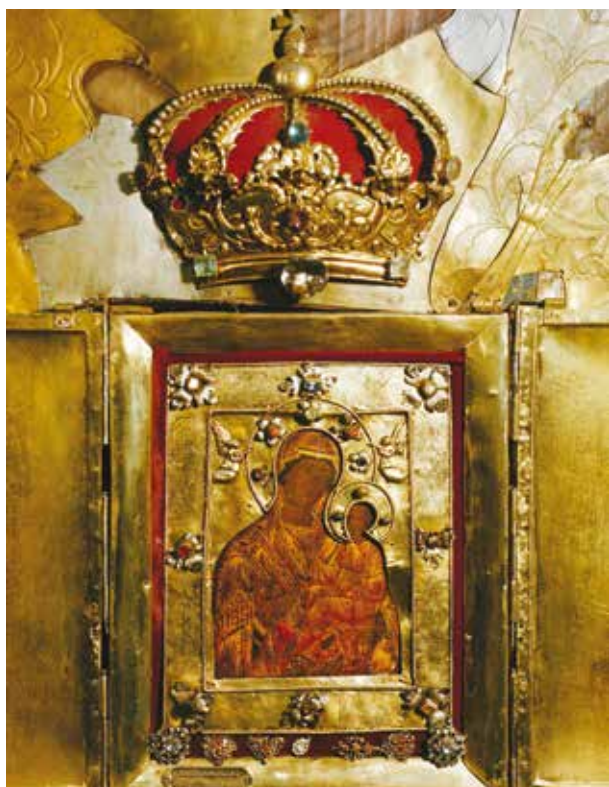
2. Tverų Švč. Mergelės Marijos paveikslas, 2004, Sigito Varno nuotrauka