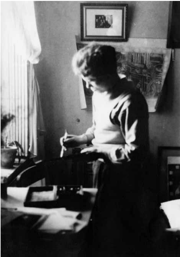
5. Uždarius Taikomosios dailės institutą.

Zenonas Varnauskas Kaune, 1943 kovo 17, ZVA