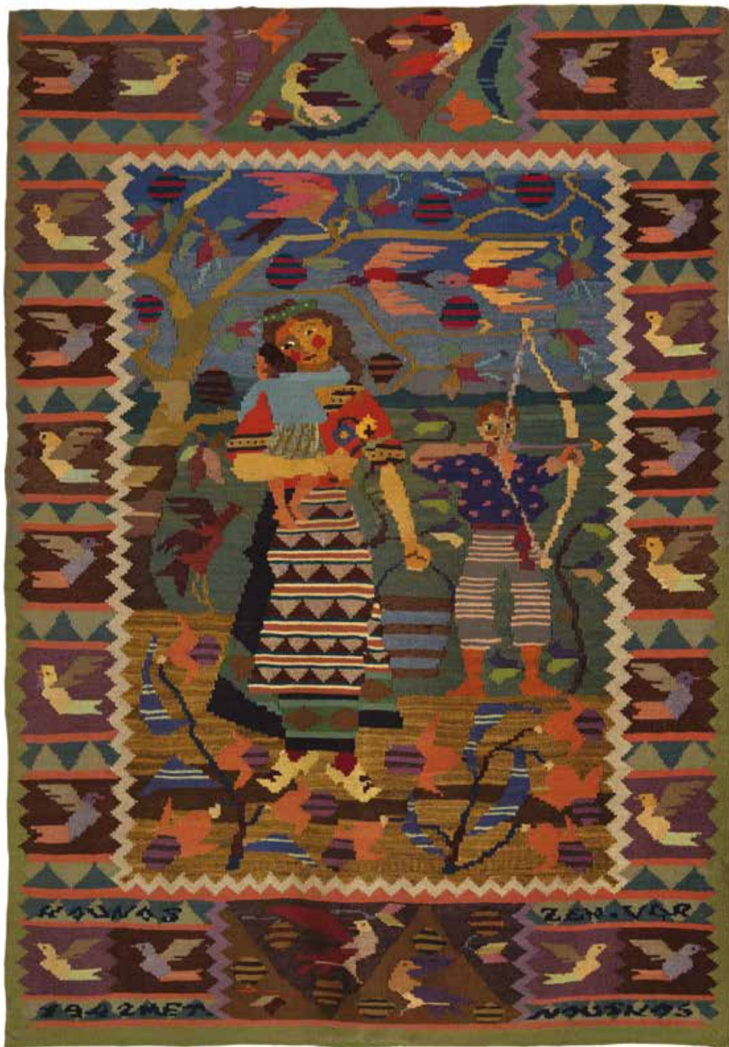
4. Zenonas Varnauskas, Motina , 1942, gobelenas, Taikomosios dailės instituto Mokslo tarybos I premija, Nacionalinis M. K. Čiurlionio dailės muziejus (toliau – ČDM, Tt-14469)