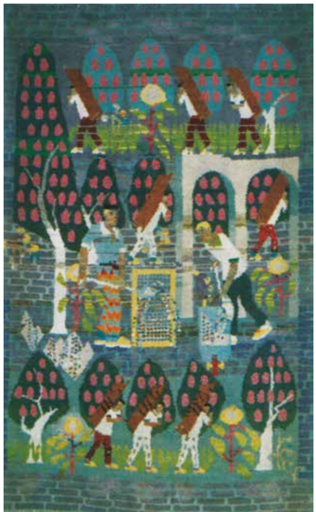
6. Zenonas Varnauskas, Statybos , 1947, diplominis darbas, rištinis kilimas, vadovas Liudas Truikys, Vilniaus dailės akademijos Tekstilės katedros muziejus

Zenonas Varnauskas, Building , 1947, diploma work, pile carpet, tutor Liudas Truikys