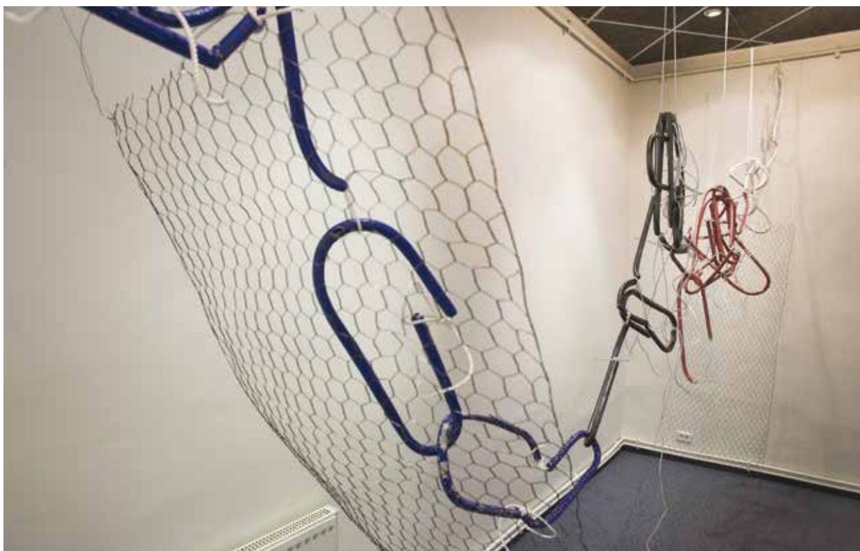
5. Aldona Keturakienė, Tiltas tarp (instaliacijos Kaune, „Eglės“ galerijoje, fragmentas), 2005, kaulo porcelianas, metalo tinklas

Aldona Keturakienė, A bridge in between (a fragment of installation in Kaunas „Egle“ gallery), 2005