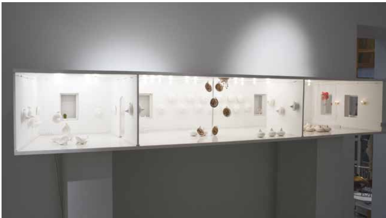
6 Aldona Keturakienė, Tylos saugotojai (instaliacijos Kaune, Kauno miesto muziejuje, fragmentas), 2008, kaulo porcelianas, juodoji keramika

Aldona Keturakienė, Saviors of the silence (a fragment of installation in Kaunas City Museum), 2008