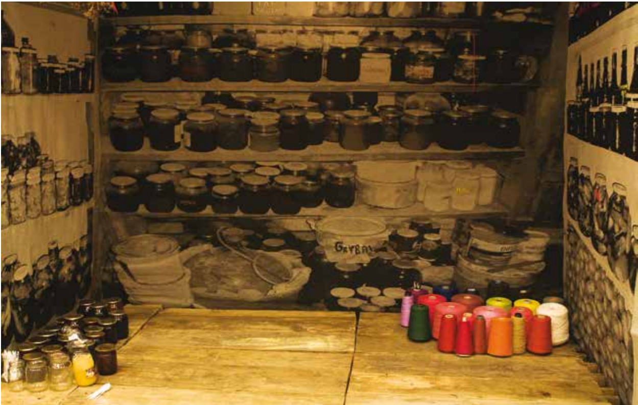
5. Monika Žaltauskaitė-Grašienė, Skladukas , 2009, instaliacija, kompiuterinis žakardinis audimas, austa UAB „Audėjas“, poliesteris, medvilnė, uogienių stiklainiai, siūlų babinos, ąžuolo grindys, 140×250×200

Monika Žaltauskaitė-Grašienė, Skladukas , 2009