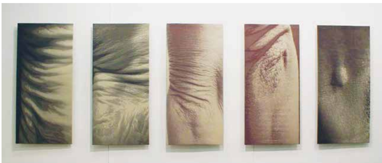
4. Monika Žaltauskaitė-Grašienė, Odos paveikslai , 2007, kompiuterinis žakardinis audimas, austa UAB „Audėjas“, poliesteris, 5 dalys, 140×70 Monika Žaltauskaitė-Grašienė, Leather Pictures , 2007