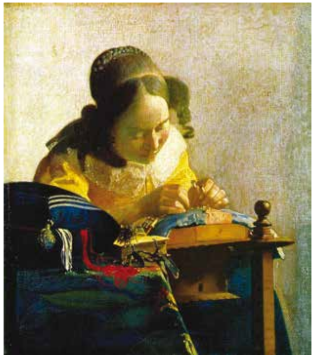
1. Johannesas Vermeeris, Nėrinių kūrėja , 1669–1670, dr., aliejus, 24×21, Luvras, Paryžius

Johannes Vermeer, The Lacemaker , 1669–1670