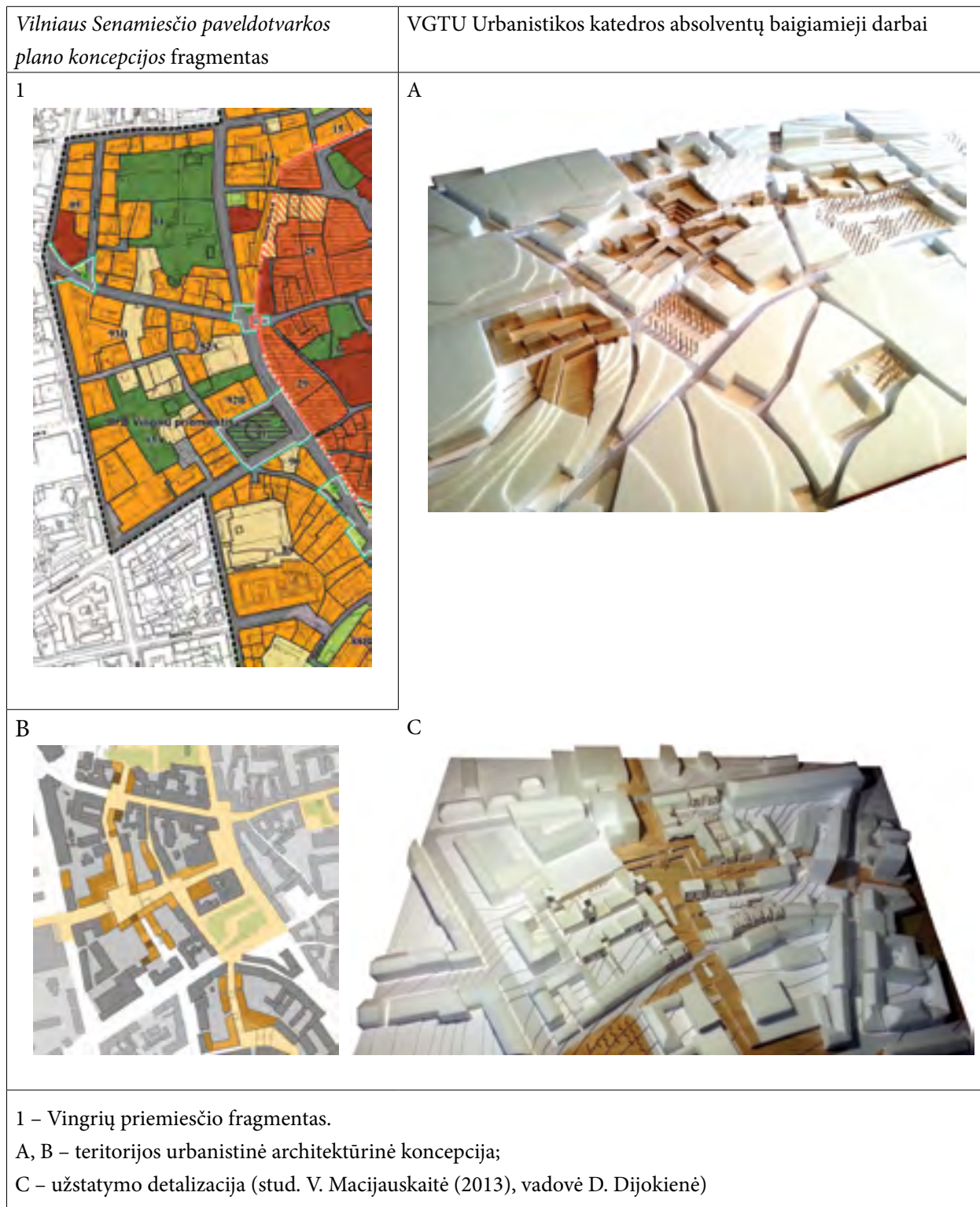
Table 4. Juxtaposition of fragments from The Concept of the Vilnius Old Town Heritage Project and academic projects of VGTU students