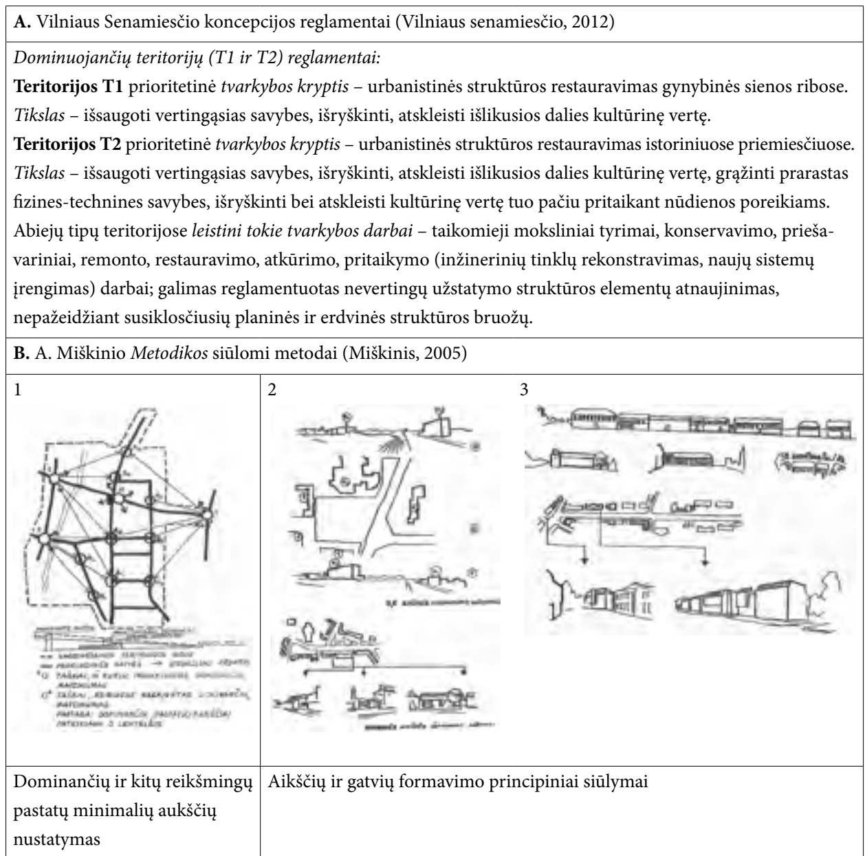
Table 2. Comparison of propositions in The Concept of Vilnius Old Town Heritage Project (A) and Methodology by A. Miškinis (1986, B)

pleksinis ir sudėtingas uždavinys. Jo sprendimas reikalauja metodinio nuoseklumo. Siekiant galutinio rezultato projektuose nuosekliai turėtų būti pereinami esamos urbanistinės struktūros ypatumų tyrimo, koncepcijos pagrindimo ir detalaus projektavimo etapai. VGTU Architektūros studijų akademinų darbų urbanistikos tematika praktika iliustruoja, kad istorinių miesto dalių plėtra gali būti sėkmingai modeliuojama. 3 ir 4 lentelėse sugretinami Vilniaus Senamiesčio paveldotvarkos projekto koncepcijos fragmentai ir tose pačiose vietose atlikti studentų projektiniai pasiūlymai.