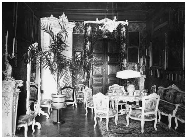
5. Psichė Alantos dvaro rūmų rokoko stiliaus kambaryje, 1903–1910, nuotrauka, neg. Nr. Owanta o8

Cheval-glass in a room of the Alanta manor house, 1903–1910, photography