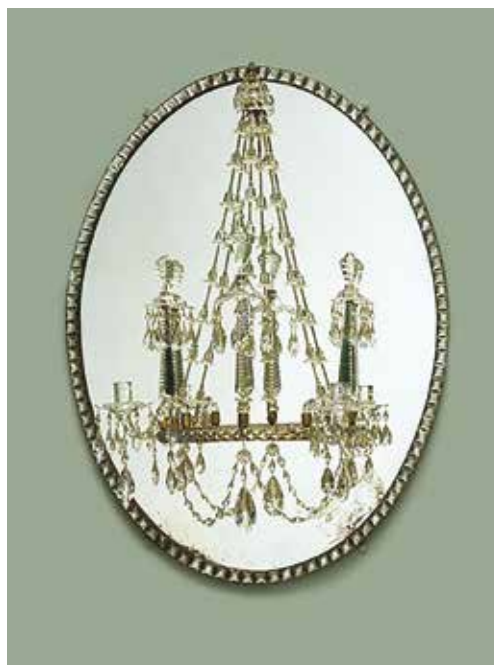
6. Veidrodis su sietynu, pagamintas 1780–1790, Airijoje, Dubline (?), veidrodinis stiklas, krištolas, saugomas Viktorijos ir Alberto muziejuje, in: V&A museum , [interaktyvus], [žiūrėta 2015-11-16]

Cheval-glass in a room of the Alanta manor house, 1903–1910, photography