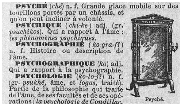
4. Psychės apibrėžimas iliustruotoje prancūziškoje enciklopedijoje, in: Petit Larousse illustre: Nouveau dictionnaire encyclopedique , 1924, p. 806

Cheval-glass description in a French encyclopaedia, 1924