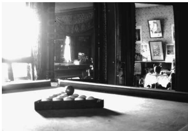
8. Markučių dvaro interjeras, biliardo kambarys, XIX a. pab. – XX a. I p. (iki 1935), negatyvas, saugomas Literatūriniame Aleksandro Puškino muziejuje, LPM N 28

Markučiai manor house interior, billiard room, from the late 19th century to the first half of the 20th century (before 1935), negative