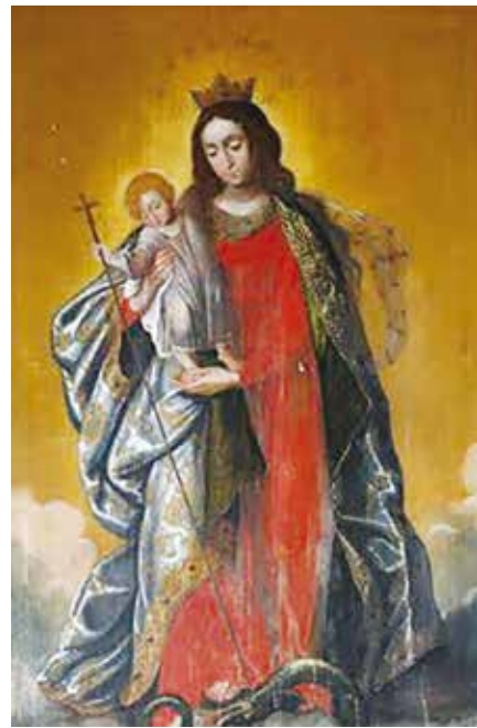
4. Nekaltojo Prasidėjimo Švč. Mergelė Marija , XVII a., Rūdinkų bažnyčia

Blessed Virgin Mary of the Immaculate Conception , 17 th c., Rūdinkai church