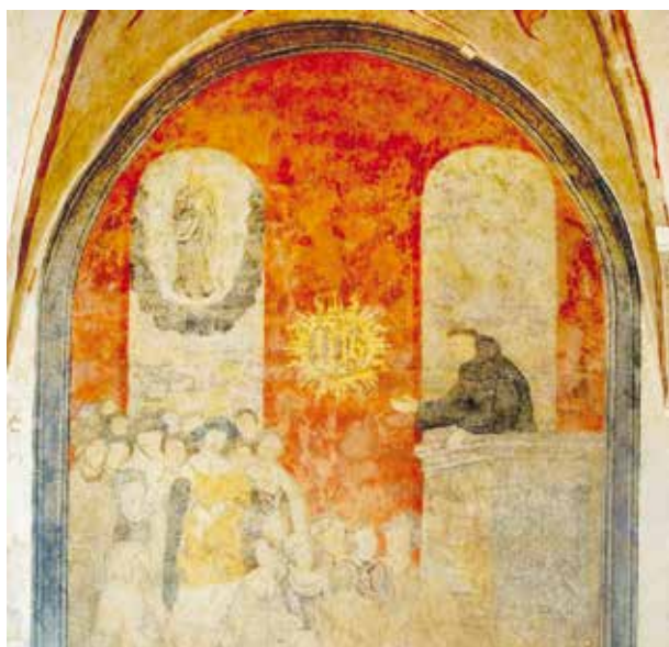
1. Nekaltojo Prasidėjimo Švč. Mergelė Marija , Vilniaus bernardinų vienuolyno sienų tapybos kompozicijos fragmentas, XVI a. pab. – XVII a. pr., Tomo Vyšniausko nuotrauka, 2009, © LATGA, Vilnius 2016

Blessed Virgin Mary of the Immaculate Conception , detail of the composition of mural painting in the Vilnius Bernardine convent, late 16 th – early 17 th c., photo by Tomas Vyšniauskas, 2009