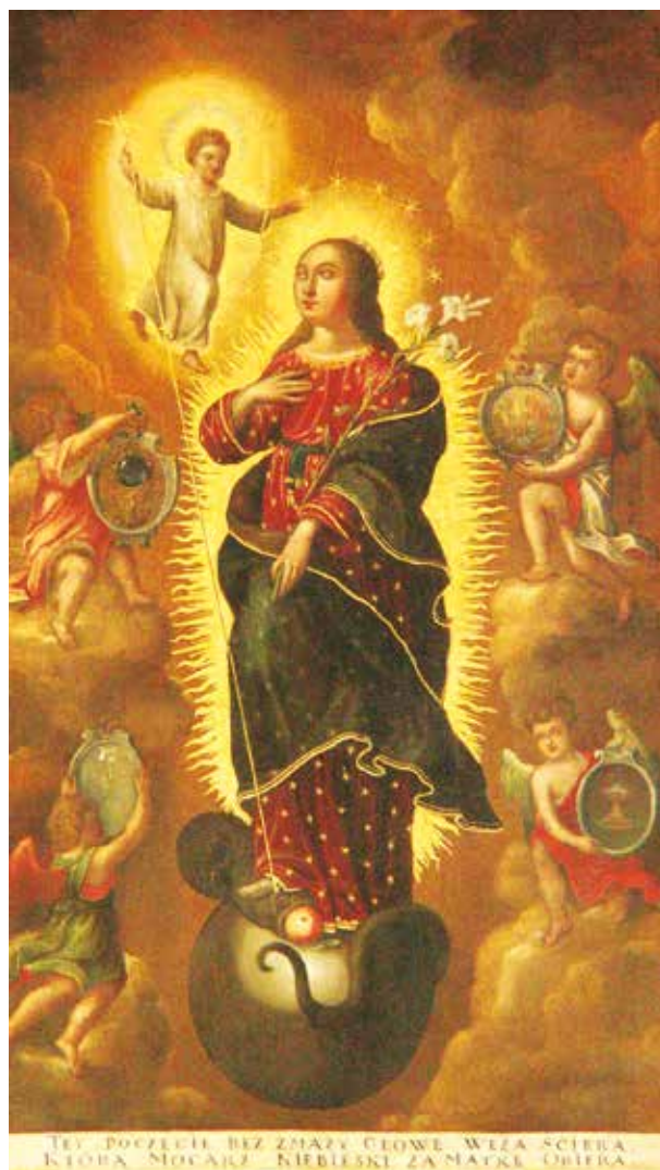
3. Nekaltojo Prasidėjimo Švč. Mergelė Marija, XVII a., Slanimo bažnyčia

Blessed Virgin Mary of the Immaculate Conception, 17 th c., Slanimas church