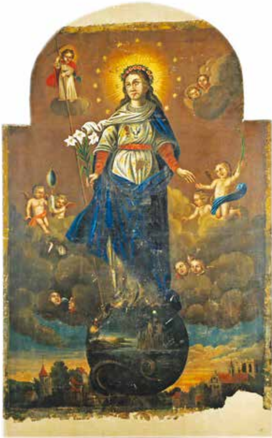
5. Nekaltojo Prasiidėjimo Švč. Mergelė Marija , XVII a., LDM, 2015

Blessed Virgin Mary of the Immaculate Conception , 17 th c., Lithuanian Art Museum, 2015