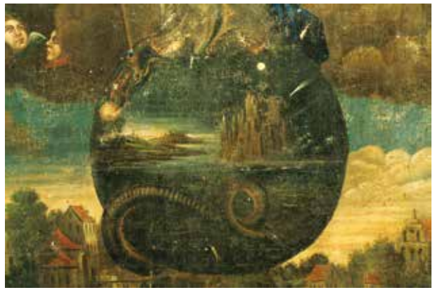
6. Pasaulio rutulys, paveikslas Nekaltojo Prasidėjimo Švč. Mergelė Marija fragmentas, Algimanto Vaineikio nuotrauka, 2015 Sphere of the Universe, detail of the painting Blessed Virgin Mary of the Immaculate Conception , photo by Algimantas Vaineikis, 2015