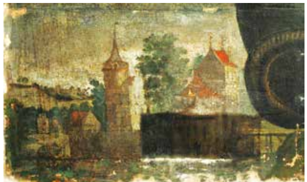
7. Miestas, paveikslas Nekaltojo Prasidėjimo Švč. Mergelė Marija fragmentas, Algimanto Vaineikio nuotrauka, 2015 City, detail of the painting Blessed Virgin Mary of the Immaculate Conception , photo by Algimantas Vaineikis, 2015