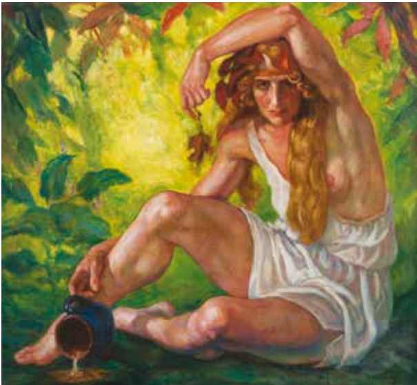
5. Petras Kalpokas, Bakchantė , apie 1923, drobė, aliejus, 108,5 × 118, LDM