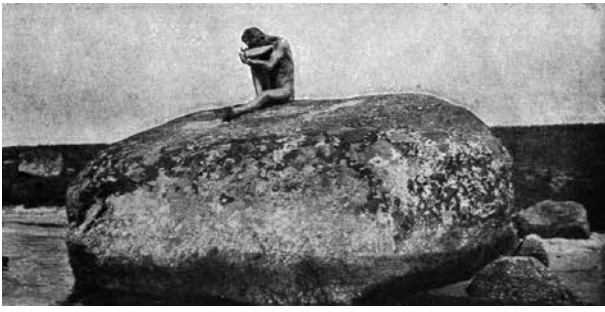
13. Vincas Uždaviny, Akmuo Dzūkijoj (vyro aktas), reprodukcija iš žurnalo Foto mėgėjas , 1933, Nr. 1 Vincas Uždaviny, A stone in Dzūkija (male nude), reproduction from Foto mėgėjas magazine, 1933, No. 1