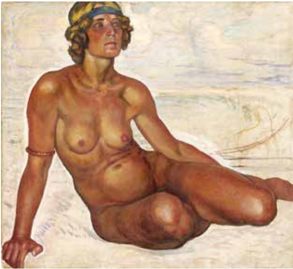
12. Petras Kalpokas, Eskizas. Moters aktas , 1933 (?), drobė, aliejus, 89 × 98, LDM

Petras Kalpokas, A sketch. Nude woman , 1933 (?)