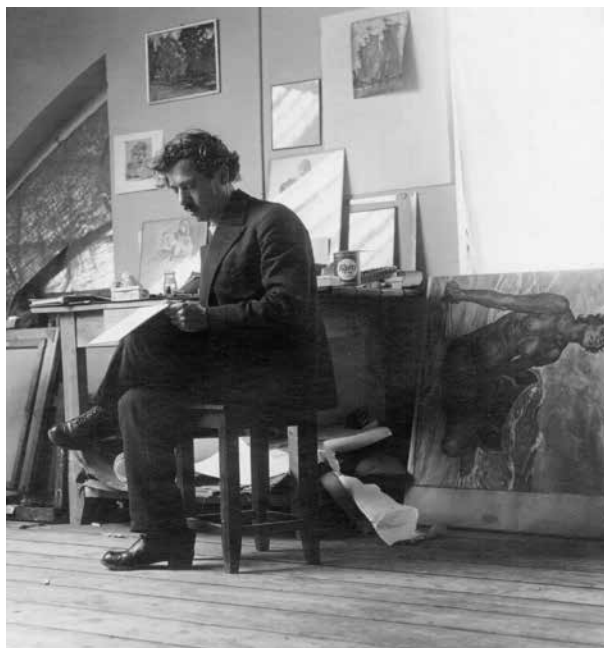
11. Petras Kalpokas savo studijoje, 1929, nuotrauka

Petras Kalpokas in his studio, 1929