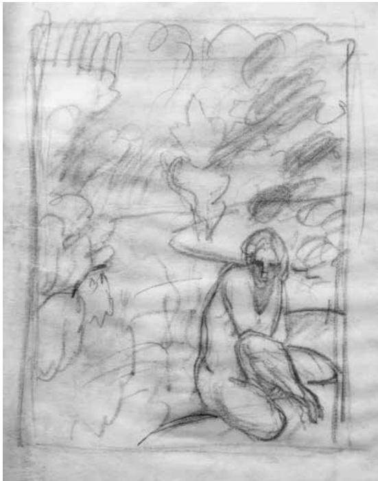
6. Petras Kalpokas, paveikslas Undinė eskizas, XX a. 3 deš., popierius, pieštukas, LTMKM

Petras Kalpokas, A sketch for the painting The Mermaid , 1920s