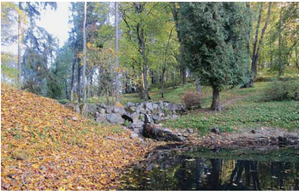
1. Charakteringas Lentvario sodybos parko fragmentas, 2016 spalvis

Characteristic detail of the Lentvaris manor park, October 2016