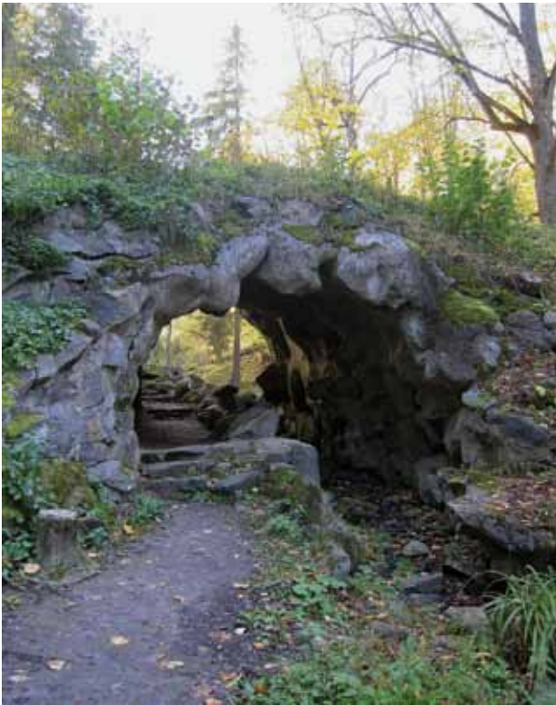
7. Tiltas-viadukas su grotu, Vytauto Petrušonio nuotrauka, 2016 spalio

Bridge-overpass with a grotto, October 2016