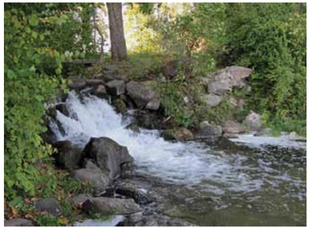
8. Didžiausias parko krioklys, Vytauto Petrušonio nuotrauka, 2010 spalio

Lentvario dvaro sodybos parko pavyzdžiu pateikta „Žemės rojaus“ temos išsklaida pagrįsta konotacijų nurodymu. Tokie duomenys galėtų papildyti dabartinį