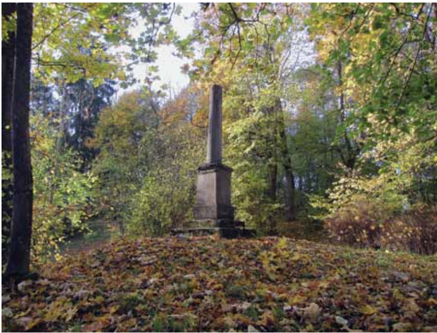
3. Lentvario parko kolona-obeliskas, Vytauto Petrušonio nuotrauka, 2016 spalio

Column-obelisk of the Lentvaris park, October 2016