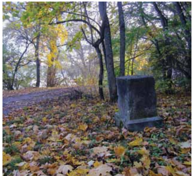
9. Postamentas, 2016 spalio

Largest waterfall in the park, October 2010