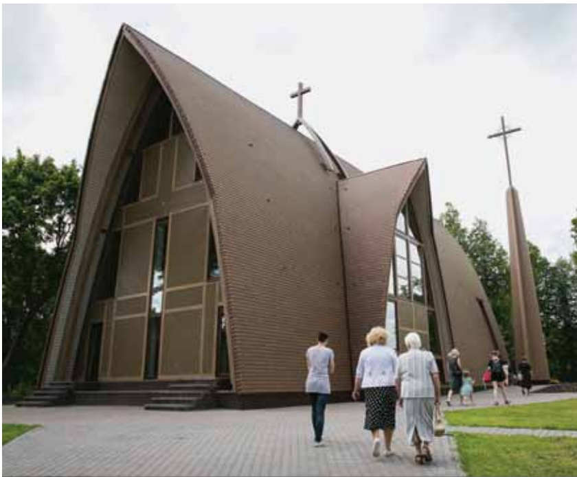
6. Nauja Dubingių bažnyčia, 2016, Marius Žičiaus nuotrauka, 2016