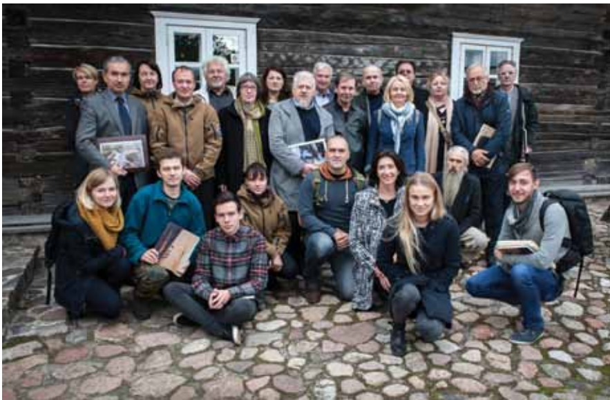
8. Menininkų plenero Dubingiuose dalyviai ir savanoriai, 2015

Participants and volunteers at the artists' plein air in Dubingiai