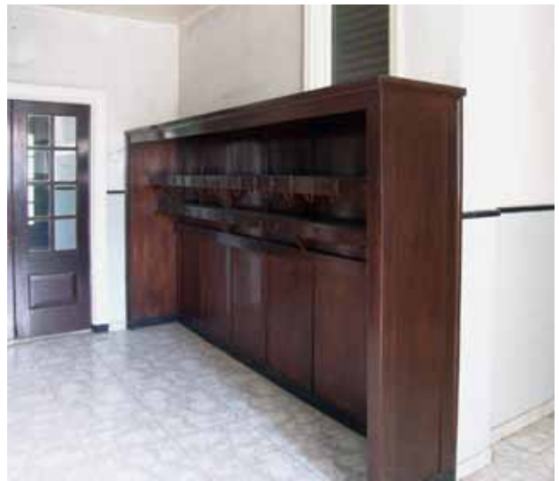
11. Drabužių kabykla, 2016