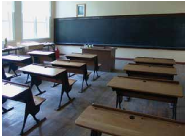
7. Amerikietiški suolai ir skalūnų lenta, 2016