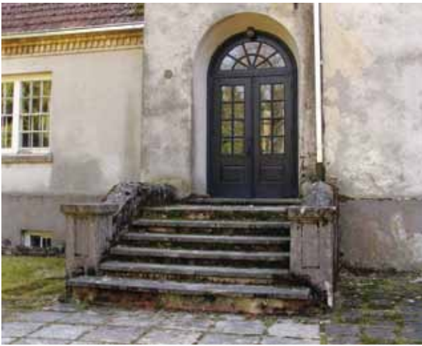
8. Pagrindinis įėjimas į mokyklą, 2016