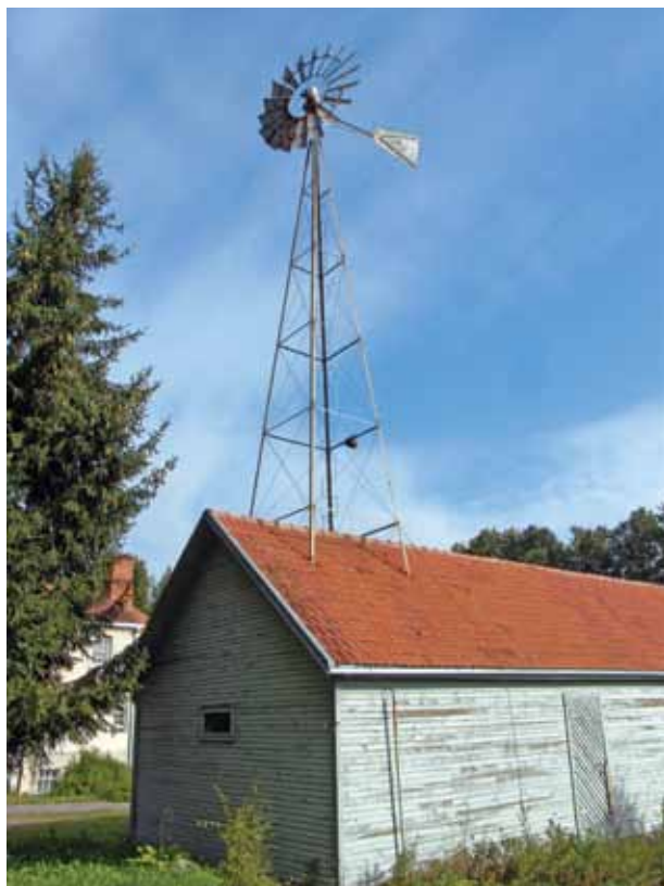
16. Vėjo jėgainė, 2016