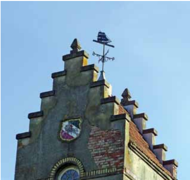
4. Vyties reljefas Kurnėnų mokyklos bokšte, Margaritos Janušonienės nuotrauka, 2016

The coat of arms of independent Lithuania (Vytis) on the Kurnėnai school tower