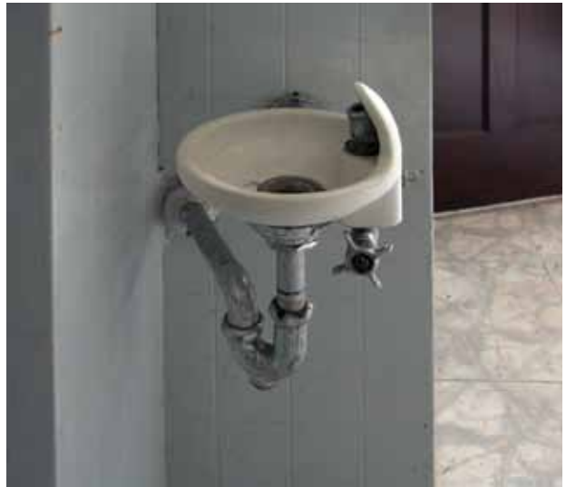
14. Geriamojo vandens fontanėlis, 2016