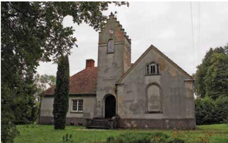
5. Pagrindinis mokyklos fasadas, 2016