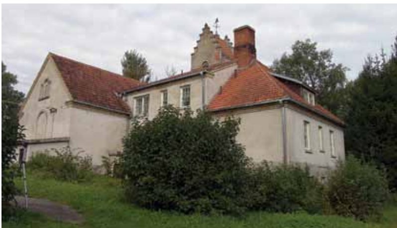
6. Kiemo pusės fasadai, 2016