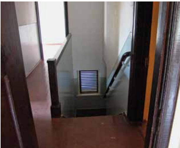
10. Mokyklos interjero fragmentas (laiptai), 2016