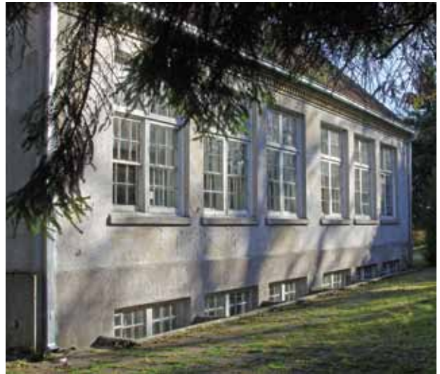
12. Mokyklos klasių langai, Margaritos Janušonienės nuotrauka, 2016