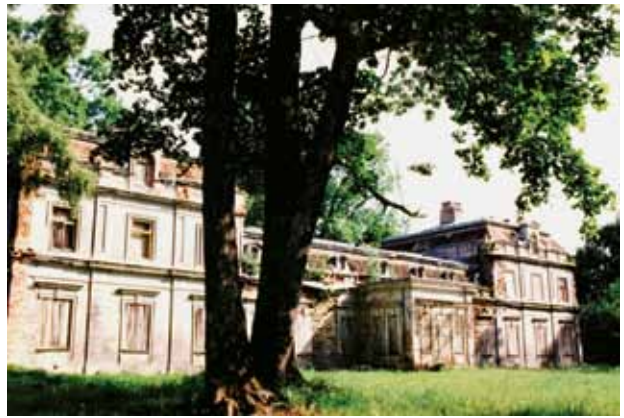
14. Apleistų Zyplių dvaro rūmų vakarinis fasadas, Vido Cikanos nuotrauka, 2002

Northern and eastern façades of the abandoned Zypliai manor palace