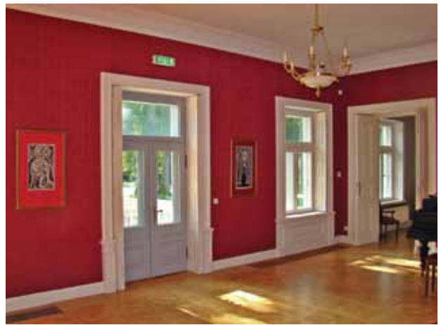
26. Restauruota šokių salė, Jolitos Butkevičienės nuotrauka, 2016