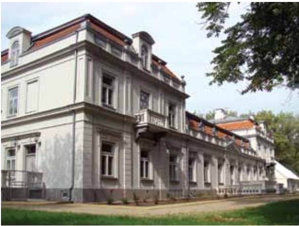
15. Restauruotų Zyplių dvaro rūmų rytinis fasadas ir pietinio fasado fragmentas, 2016

Western façade of the abandoned Zypliai manor house