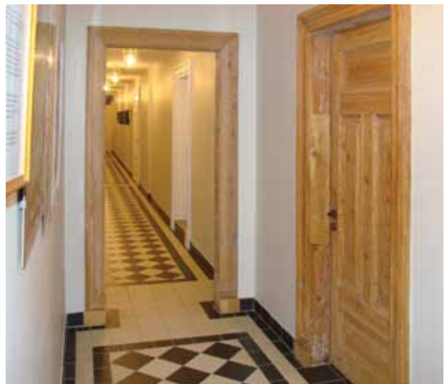
31. Restauruoto antro aukšto koridoriaus fragmentas, durys – autentiškos, pirmam aukštui artimų grindų plytelių danga įrengta pagal priešgaisrinius reikalavimus, Jolitos Butkevičienės nuotrauka, 2016

Fragment of the wooden staircase after restoration