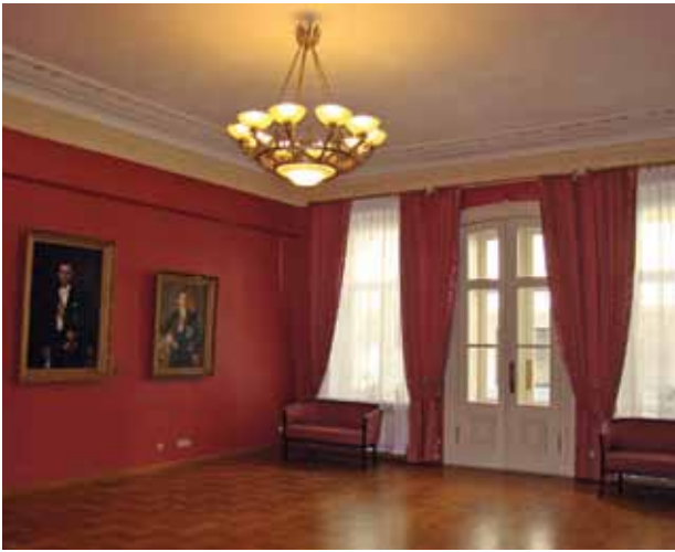
10. Restauruota Posėdžių salė, Jolitos Butkevičienės nuotrauka, 2016