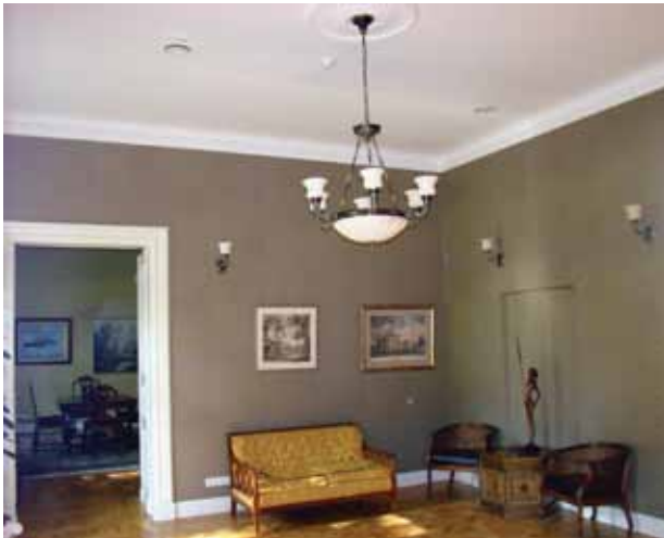
28. Restauruotas svečių kambarys, 2016

Restored rosette with a stylized chandelier