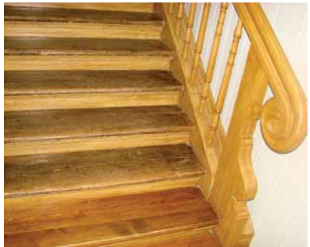
30. Restauruotų medinių laiptų fragmentas, pakopos išlikusios autentiškos, balesinos ir porankiai restauruoti, Jolitos Butkevičienės nuotrauka, 2016

Fragment of the wooden staircase after restoration