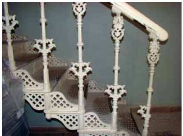
4. Išsaugotų autentiškų ketaus laiptų fragmentas, 2016

Authentic cast iron staircase (the Gubernia period)