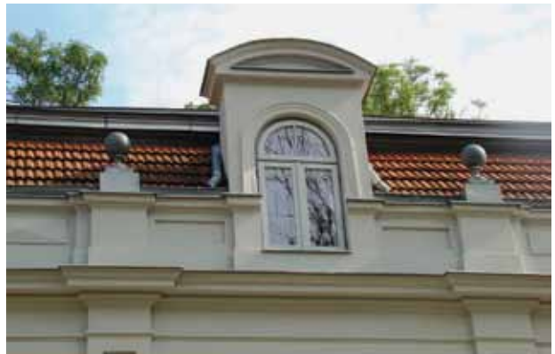
20. Restauruota liukarna, 2016

Authentic view of the lucarne framed by volutes