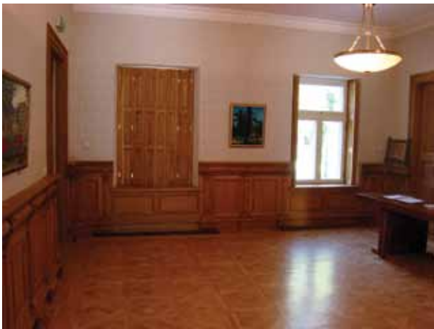
25. Restauruota valgomojo patalpa, Jolitos Butkevičienės nuotrauka, 2016