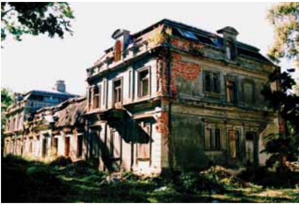
13. Apleistų Zyplių dvaro rūmų šiaurinis (galinis) ir rytinis fasadai, 2002

Northern and eastern façades of the abandoned Zypliai manor palace