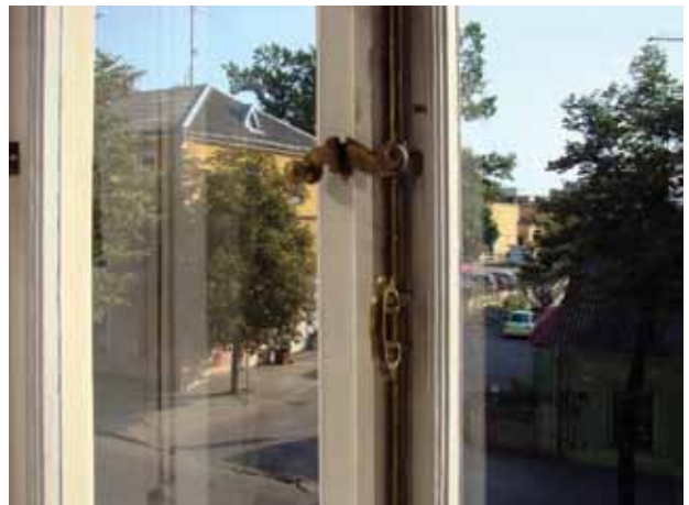
9. Konservuotas autentiškas lango uždarymo mechanizmas, 2016

Preserved authentic mechanism of the window lock