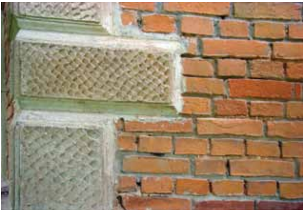
32. Tvarkomo amatininkų namo smėliasrove nuvalytos sienos fragmentas, 2016

Walls of the craftsmen's house after sandstorm cleaning