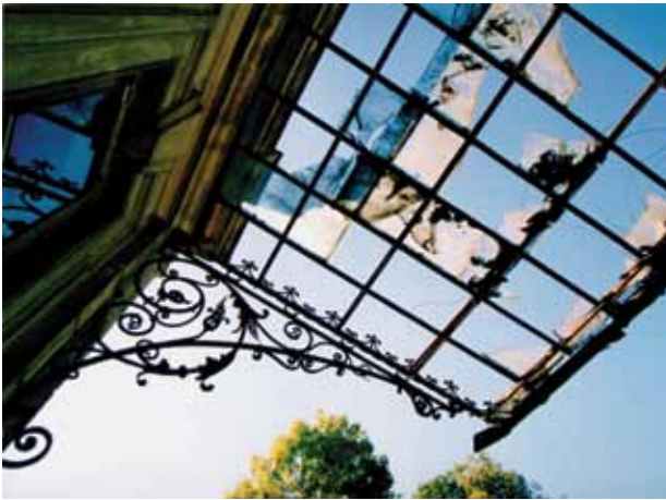
22. Autentiško vakarinio fasado įėjimo stogelio vaizdas prieš restauravimą, Vido Cikanos nuotrauka, 2002

Authentic view of the marquee of the western façade before restoration