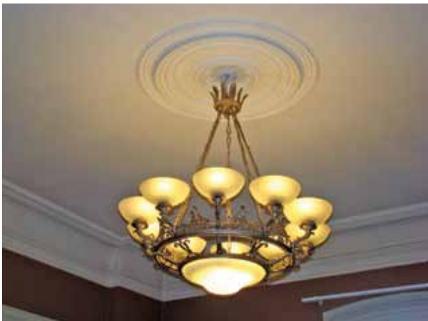
8. Restauruotas tambūro XIX a. pab. lubų plafonas ir XX a. pr. šviestuvai, 2016

Restored nineteenth-century platform ceiling and a twentieth-century chandelier