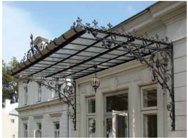
23. Restauruotas vakarinio fasado įėjimo stogelis, 2016

Authentic view of the marquee of the western façade before restoration