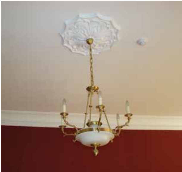
27. Restauruota šokių salės rozetė su stilizuotu šviestuvu, 2016

Restored rosette with a stylized chandelier