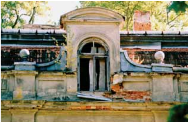
19. Liukarnos ir ją rėminusių volių autentiškas vaizdas, Vido Cikanos nuotrauka, 2002

Reconstructed balcony and metal consoles of the eastern façade