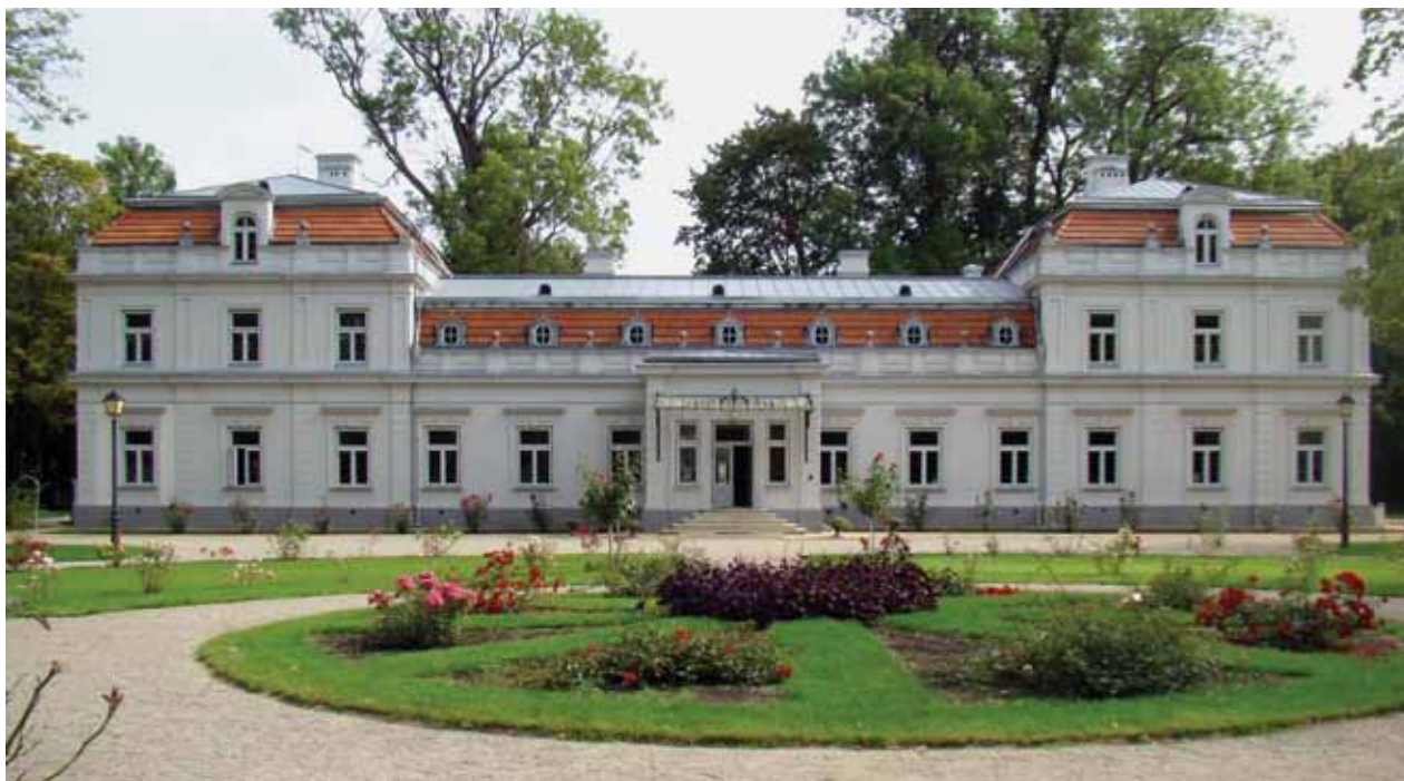
16. Restauruotų Zyplių dvaro vakarinis fasadas, Jolitos Butkevičienės nuotrauka, 2016

Restored western façade of the Zypliai manor house