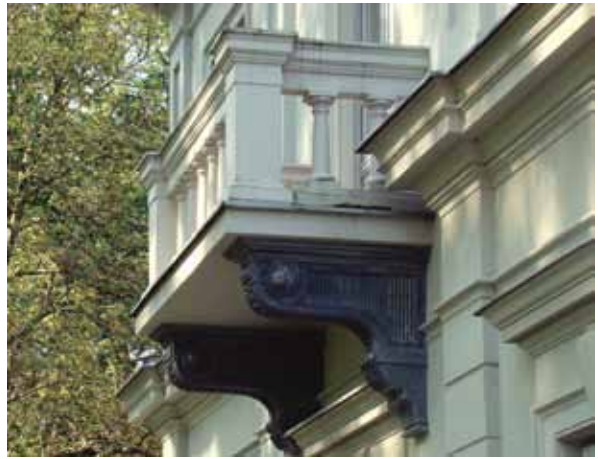
18. Atstatytas rytinio fasado balkonas ir metalinės konsolės, Jolitos Butkevičienės nuotrauka, 2016

Central part of the restored eastern façade of the Zypliai manor house