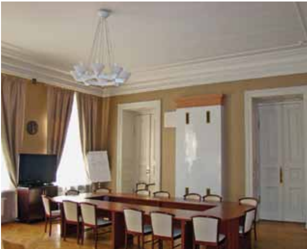
11. Restauruotas Ministro pirmininko kabinetas, 2016

Prime Minister's office after restoration