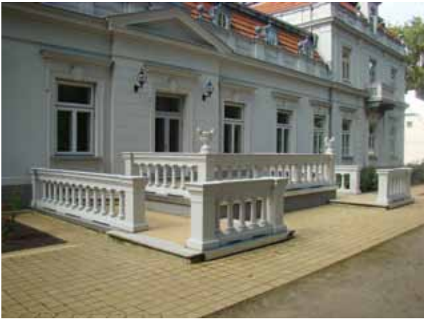
17. Restauruoto rytinio fasado centrinės dalies fragmentas: terasa, langų apvadai ir sandriakai, karnizai bei kitos architektūrinės detalės, 2016

Central part of the restored eastern façade of the Zypliai manor house