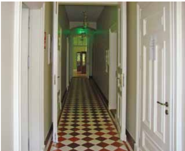
29. Restauruoto pirmo aukšto koridoriaus fragmentas, matosi dalis konservuotų ir suremontuotų grindų plytelių dangos bei pagal autentiškas pagamintų durų fragmentai, Jolitos Butkevičienės nuotrauka, 2016

Fragment of the restored corridor on the ground floor