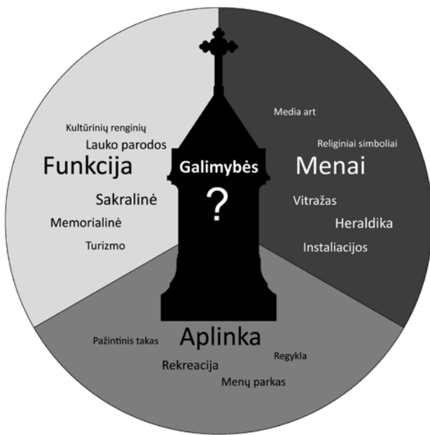
2 schema. Fišerių koplyčios pritaikymo galimybių idėjinis laukas pagal tris sritis: funkcija, menai, aplinka

Scheme 2. Ideas for the use of the Fiszer family chapel according to three areas: function, arts, environment