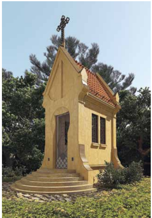
7. Koplyčios rekonstrukcijos projekto eksterjero vizualizacijos, pietvakarių vaizdas, Lino Krūgelio nuotrauka, 2010

konstrukciniai sprendiniai. Atkuriamam sunykusiam mūriui turi būti naudojama rišamojo skiedinio sudėtis analogiška autentiškai. Stogas uždengiamas kokybiškomis sezoniškumui atspariomis keraminėmis čerpėmis, kurių profilis būtų analogiškas autentiškoms čia buvusioms čerpėms. Stogas ir fasado plastiniai elementai turi būti aptaisomi skardos apvaisais ir latakais, apsaugant juos nuo kritulių poveikio. Fasada tinkuojami kalkinio pagrindo tinku, kurio sudėtis sutaptų su autentišku tinku, taip būtų užtikrinta apdailos ilgaamžiškumo ir kokybiškų medžiagų tarpusavio dermė. Fasada turi būti