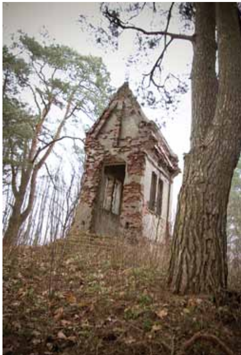
1. Eksterjero fotofiksācijas, Lino Krūgelio nuotrauka, 2009