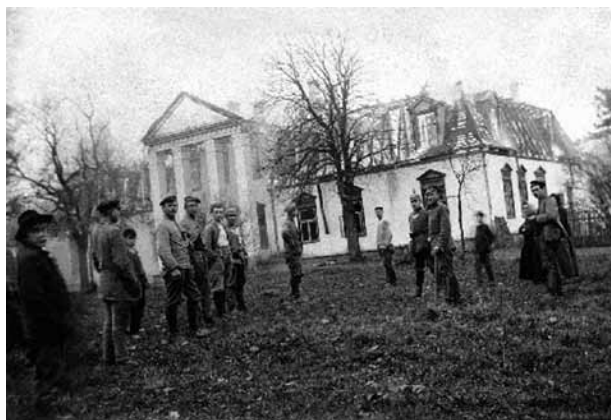
3. Gaurės dvaras gaisro metu, 1915