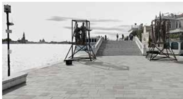
2. Audrius Ambrasas, Diskusijų tiltas , projektas, 2015, in: Ambraso architektų biuras, Diskusijų tiltas . Pasiūlymas 15-ajai Venecijos architektūros bienalei

Gediminas Urbonas, You Come, You Leave , installation, 1995, photo by Arūnas Baltėnas