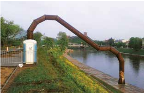
4. Krantinės arka, fotomanipuliacija, 2014, [interaktyvi], [žiūrėta 2017-05-07], http://www.madeinvilnius.com/lt/gyvenimas/vilnieciai-savivaldybes-praso-vamzdi-prie-neries-iskelti-i-kita-vieta/i

Embankment Arch , photo manipulation, madeinvilnius.lt photo, 2014, [interactive], [seen on 7 May 2017], http://www.madeinvilnius.com/lt/gyvenimas/vilnieciai-savivaldybes-praso-vamzdi-prie-neries-iskelti-i-kita-vieta/i/