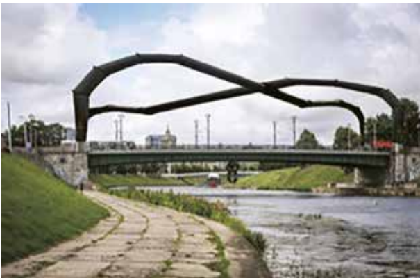
5. Žaliojo tiltas , fotomanipuliacija, 2015, [interaktyvi], [žiūrėta 2017-05-07], http://www.delfi.lt/pilietis/temos/ka-statyti-ant-zaliojo-tilto-pasiulymai.d?id=68553416&ccpage=2#!/ccid=1513907-i94105

Embankment Arch , photo manipulation, madeinvilnius.lt photo, 2014, [interactive], [seen on 7 May 2017], http://www.madeinvilnius.com/lt/gyvenimas/vilnieciai-savivaldybes-praso-vamzdi-prie-neries-iskelti-i-kita-vieta/i/