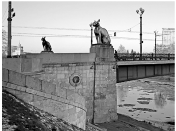
6. Liudas Parulskis, Fotomanipuliacija Ernesto Parulskio komentarui „Kačiukai gali laimėti“ , fotomanipuliacija, meno projektas 7 meno dienos, 2014

Liudas Parulskis, Kittens May Win. Photo manipulation for Enestas Parulskis commentary , photo manipulation, art project in 7 Meno Dienos weekly, 2014