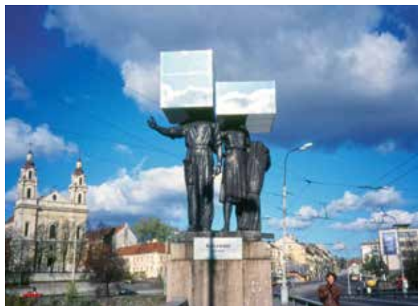
1. Gediminas Urbonas, Ateini ir išeini , instaliacija, 1995, Arūno Baltėno nuotrauka

Gediminas Urbonas, You Come, You Leave , installation, 1995, photo by Arūnas Baltėnas