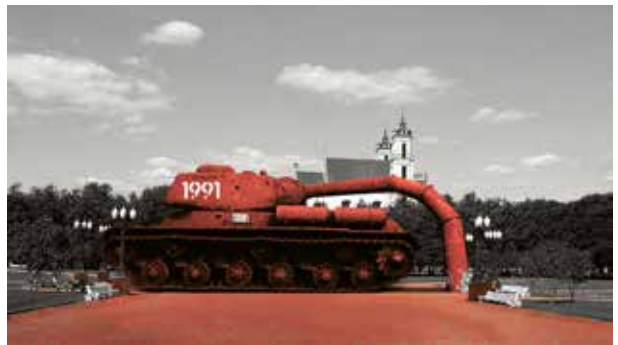
7. Eglė Rakauskaitė, Utopinis Vilnius , Lukiškių aikštė, fotosimuliacija, 2010

Liudas Parulskis, Kittens May Win. Photo manipulation for Enestas Parulskis commentary , photo manipulation, art project in 7 Meno Dienos weekly, 2014