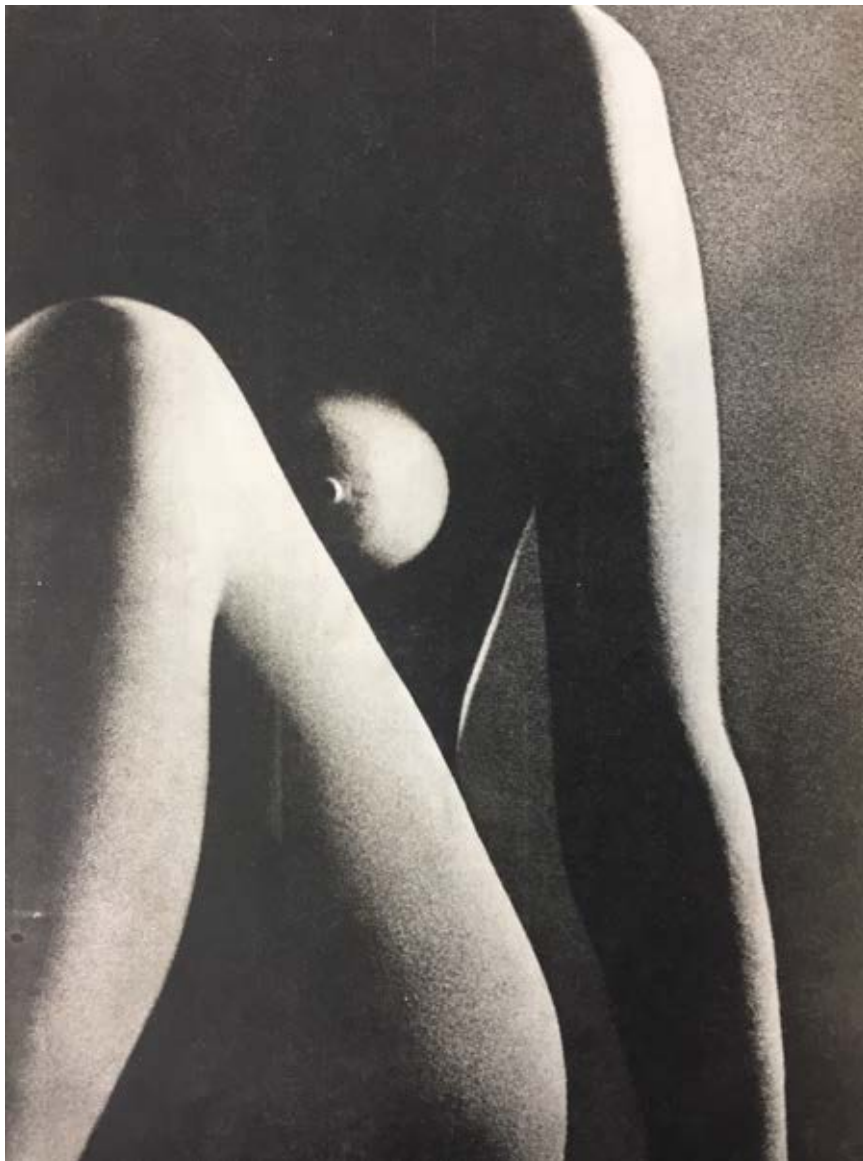
1. Pirmasis žurnale Nemunas publikuotas aktas, aut. Vilius Naujikas, in: Nemunas , 1967, Nr. 2