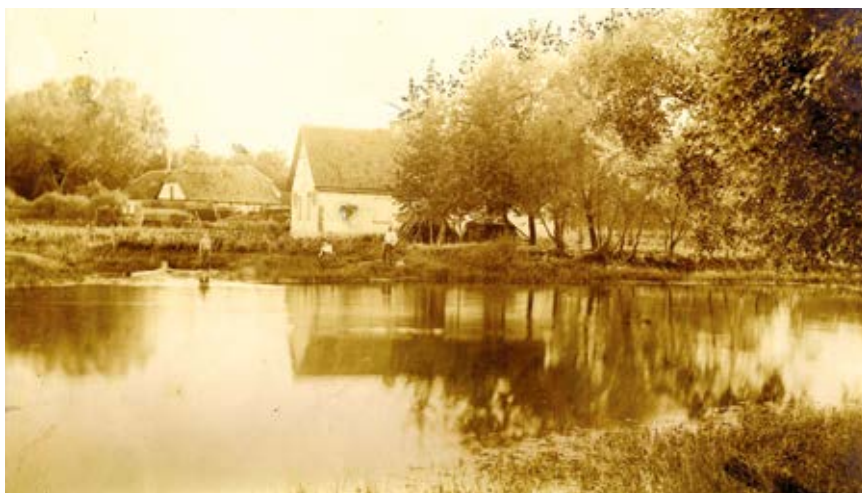
11. Kūdra ir kumetynas (A-11), apie 1910