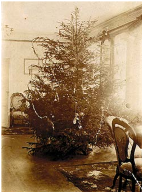
10. Kalėdinė eglutė svetainėje, apie 1910, Johano Grothuso nuotrauka Christmas tree in the living room ca. 1910