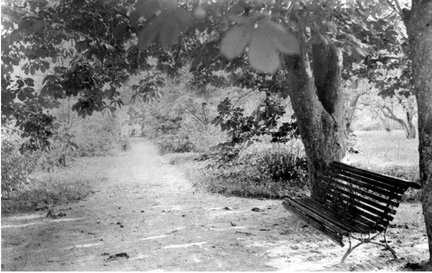
17. Parko kaštonų alėja, apie 1910