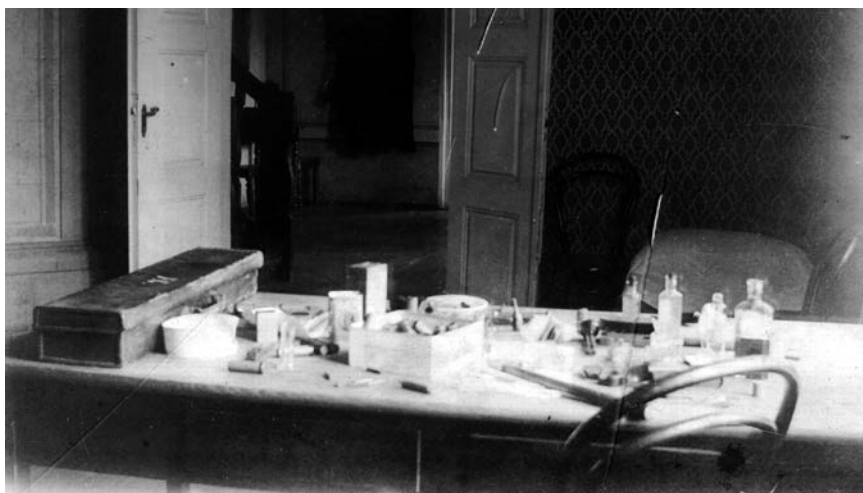
9. Vaikų kambarys, apie 1910, Johano Grothuso nuotrauka Nursery ca. 1910

Detail of the master's house (A-1) with a closed glassed porch in winter; ca. 1910