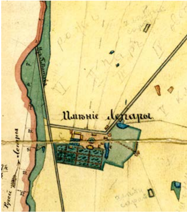
5. Lieporu dvāro sodyba, plano fragmentas, 1885, LVIA, f. 542, ap. 1, b. 262, l. 1