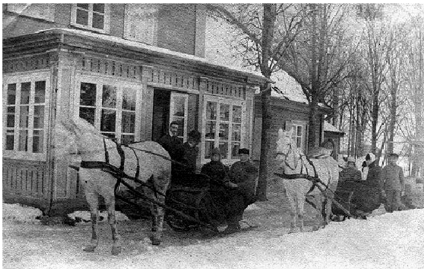
8. Ponų namo (A-1) su uždaru, įstiklintu prieangiu detalė žiemą, apie 1910

Detail of the master's house (A-1) with a closed glassed porch in winter; ca. 1910