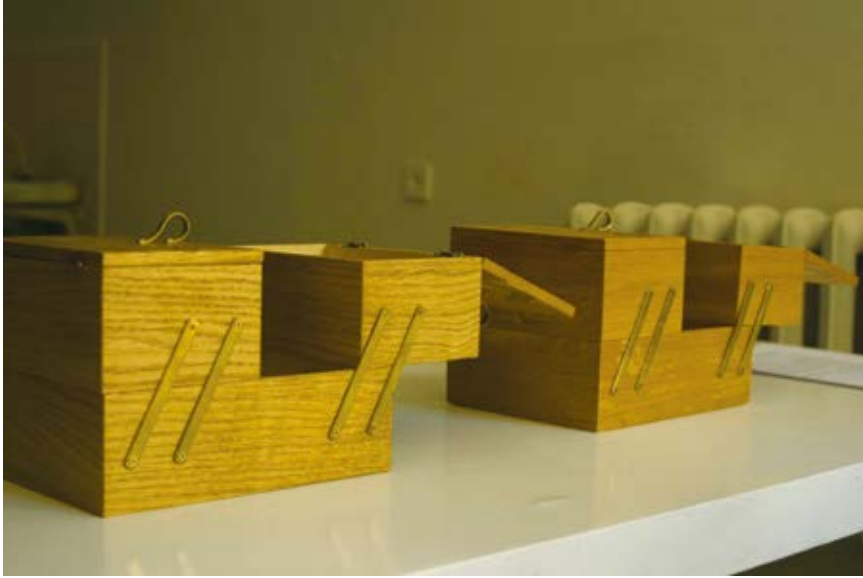
1. Viktorija Damerell, Atsidėti , 2012, vaizdo kūrinys, medinės dėžutės originalas ir kopija