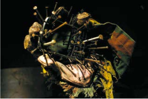
5. Fiona Hall, Fall Prey , 2009–2012, dOCUMENTA(13) bienalė, Kaselis, Vokietija, instaliacija, 2013