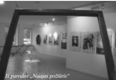
Iš parodos „Naujas požiūris“