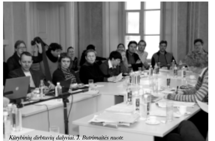
Kūrybinių dirbtuvių dalyviai.