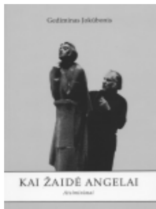
Gediminas Jokūbonis Kai žaidė angelai. Atsiminimai. V., 2009 Dailininkė Eglė Jokūbonytė

Naujas, jau 51-asis Acta Academiae Artium Vilnensis tomas, parengtas prieš keletą metų Lietuvos dailės muziejaus ir VDA Dailėtyros instituto surengtoje tarptautinėje mokslinėje konferencijoje „Lietuvos sakralinė dailė: atodangos ir naujieji kontekstai“ skaitytų pranešimų pagrindu. Tiražas 500 egz.