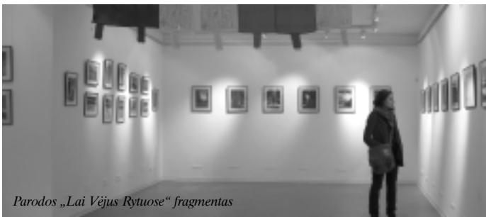
Parodos „Lai Vėjus Rytuose“ fragmentas

30 d. Dizaino katedroje studentai dalijasi įspūdžiais iš tarptautinės parodos Salone Satellite WorldWide Moscow 2008