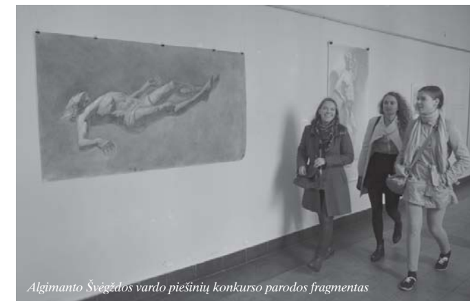
Algimanto Švėgždos vardo piešinių konkurso parodos fragmentas