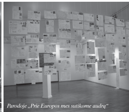
Parodoje „Prie Europos mes sutikome audrą“