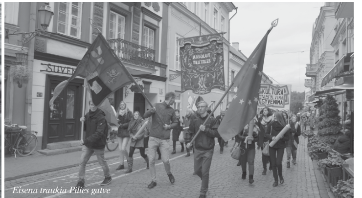
Eisena traukia Pilies gatvę