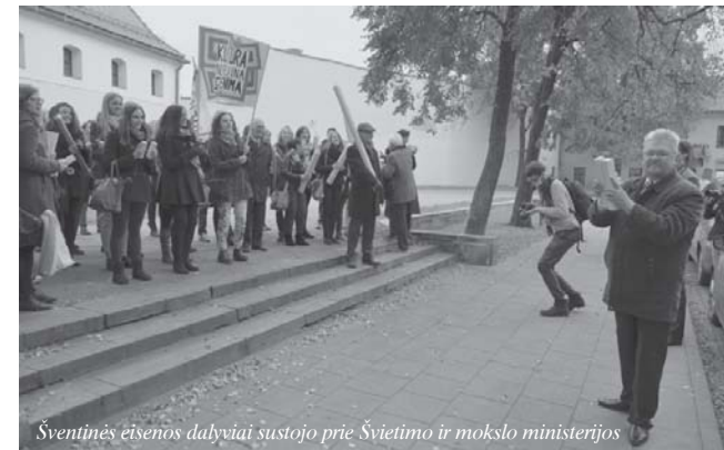
Šventinės eisenos dalyviai sustojo prie Švietimo ir mokslo ministerijos