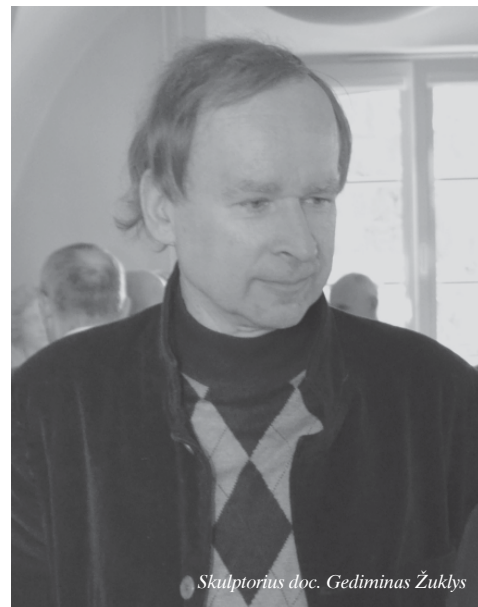
Sculptorius doc. Gediminas Žuklys