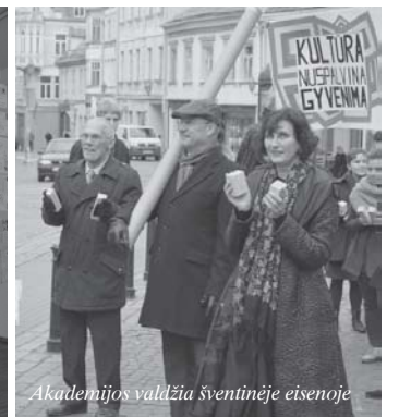
Akademijos valdžia šventinėje eisenoje