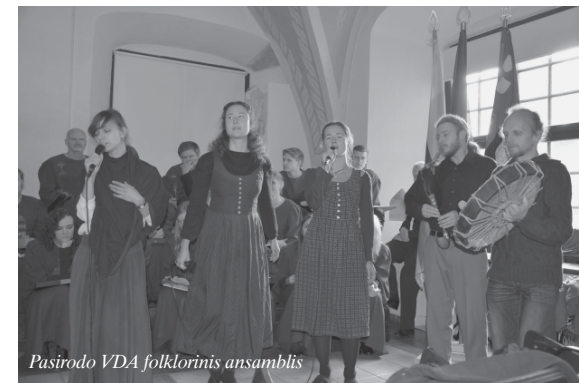
Pasirodo VDA folklorinis ansamblis