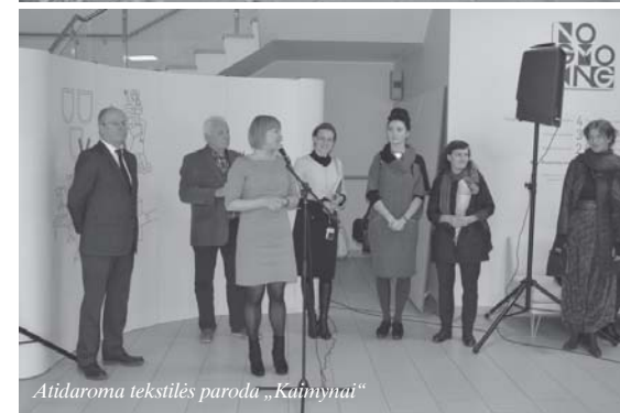
Atidaroma tekstilės paroda „Kūniyniai“